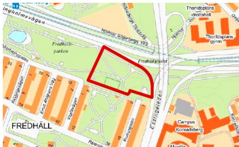
Figur 1. Planområdet markerat med röd linje

Syftet med detaljplanen är att pröva förutsättningarna för att placera en 11-manna fotbollsplan i den östra delen av Fredhällsparken. Förutom fotbollsplanen tillkommer även förrådsbyggnader och driftsytor. På Stadshagens IP läggs en av 11-manna-planerna ner för att ge plats åt nya bostäder och därför behöver en ny fotbollsplan av motsvarande storlek lokaliseras på annan plats i stadsdelen. Nu föreslås östra delen av Fredhällsparken bli planlagd för ändamålet, se figur 1. Förslaget innebär även omläggning av gång- och cykelbanor.