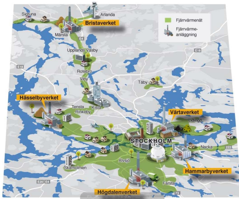
Figur 1. Det sammankopplade fjärrvärmesystemet i Stockholm där Värtaverket utgör en viktig anläggning.

I centrala Stockholm finns ett av Europas största system för fjärrvärme och fjärrkyla. Produktionen omfattar även el och sker i huvudsak vid Värtaverket – en välkänd del av Stockholms stadsprofil. I maj 2016 invigdes biokraftvärmeverket KVV8.