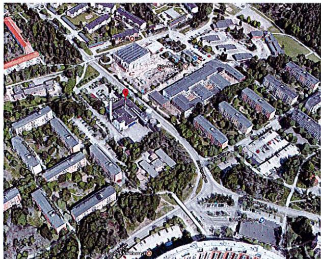
3D vy över området

För fastighet Bollmora 6:1 gäller detaljplan 121 - Nybodaberg och Granbacken samt skolområde i Nyboda som vann laga kraft 1966-12-14. Den gällande planen anger panncentral och jämförligt.