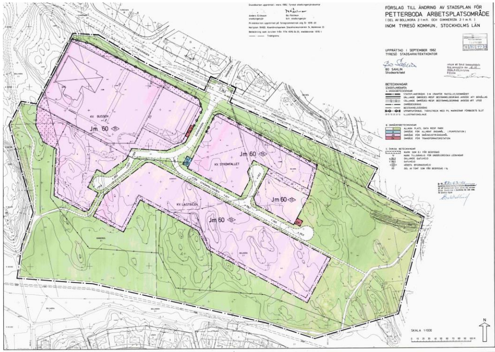
Plankarta, detaljplan 199

I gällande detaljplan är området för upphävandet planlagt som allmän plats för parkändamål.