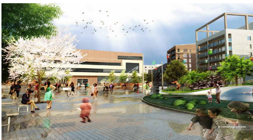
Vy från intilliggande omgivning mot skolan

Avsikten är att skolan ska ha kapacitet att inrymma totalt 740 elever mellan förskoleklass och årskurs sex. Ytorna kommer att i största möjliga mån att utformas i enlighet med utbildningsnämndens funktionsprogram. Totalt kommer skolan att bli ca 8 100 kvm.