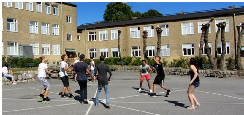
Bild 1. Sundbyskolan sedd från skolgården.

Sundbyskolan, som ligger beläget i ett villaområde med goda kommunikationer, har redan i dagsläget tillgång till flera viktiga funktioner i form av specialsalar, bibliotek och en generös skolgård. Dessa faktorer tillsammans med närheten till flera nybyggnadsområden, gör det lämpligt att vidareutveckla och utöka kapaciteten för Sundbyskolan.