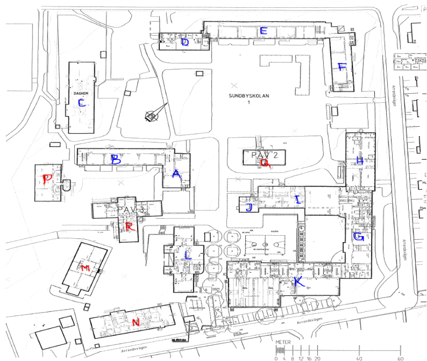
Bild 2. Situationsplan Sundbyskolan. De blåmarkerade är permanenta byggnader, medan rödmarkerade är paviljonger.

I några av byggnaderna saknas lärarrum och personalrum, vilket skapar problem då skolbyggnaderna är utspridda över en stor yta. I låg- och mellanstadiet ska lärarna ha översyn och närhet till eleverna även vid raster, varför lärarrum bör placeras i varje byggnad. Vidare är elevhälsan i behov av en mer ändamålsenlig lokal och ett antal grupprum ska tillskapas för att ge bättre förutsättningar för den pedagogiska verksamheten.