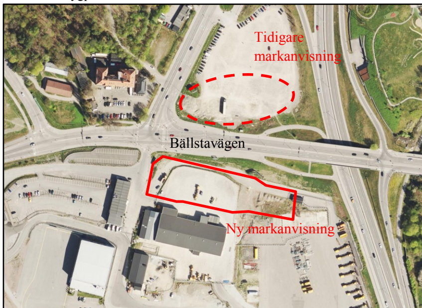
Ortofoto med markanvisningsområdet samt tidigare anvisat område markerat Förslaget innehåller nybyggnation av en servicestation med pumpar och tillhörande

OK-Q8 AB, nedan kallat bolaget, föreslås få en markanvisning inom del av Riksby 1:3, söder om Bällstavägen, för servicestation om ca 6 900 kvm tomtyta. Marken är inte detaljplanelagd och utgörs idag främst av parkeringsplatser och körytor tillhörande flygplatsområdet.