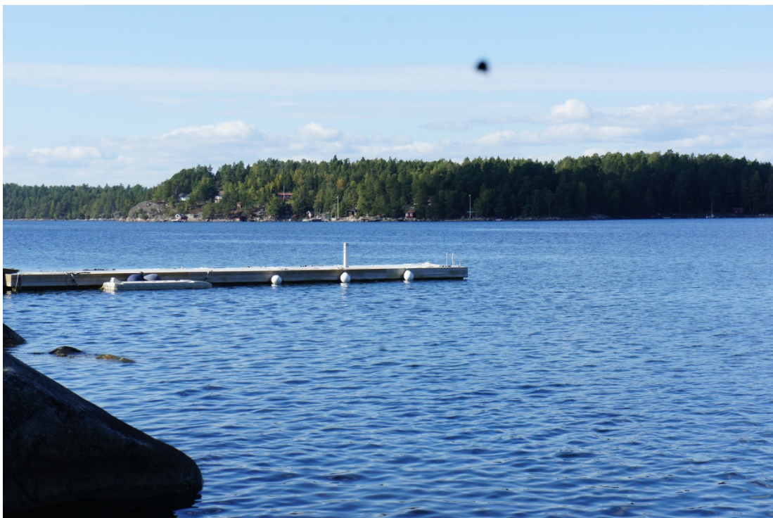
Grannens nya tungponton (Överby 108:1)

Vår grannes tomt Överby 108:1 liknar i allt väsentligt vår tomt, möjligen kan anföras att deras huvudbyggnad ligger något längre från stranden än vår huvudbyggnad.