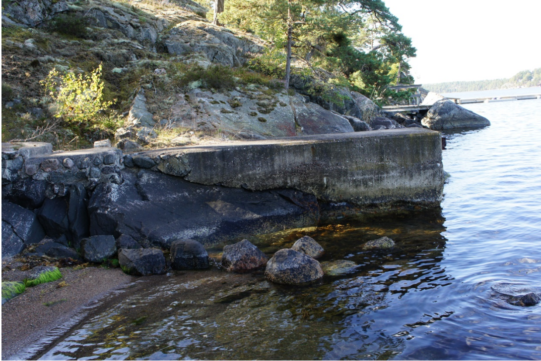
Bryggfästet, grannens nya tungponton i bakgrunden

Beträffande Överby 107:1 har alltid brygga hört till fastigheten. De tidigare ägarna, äldre och sjukliga, lät fastigheten på senare år ligga för fäbot och yttre delen av den befintliga bryggan rasade. Bryggfästet finns emellertid kvar och kan fortfarande tjäna som tilläggsplats. Från bryggan finns sedan länge en anlagd stentrappa upp mot huvudbyggnaden. Avståndet mellan bryggfästet och huvudbyggnaden är ca 22 m och det råder fri sikt från huvudbyggnaden mot stranden.