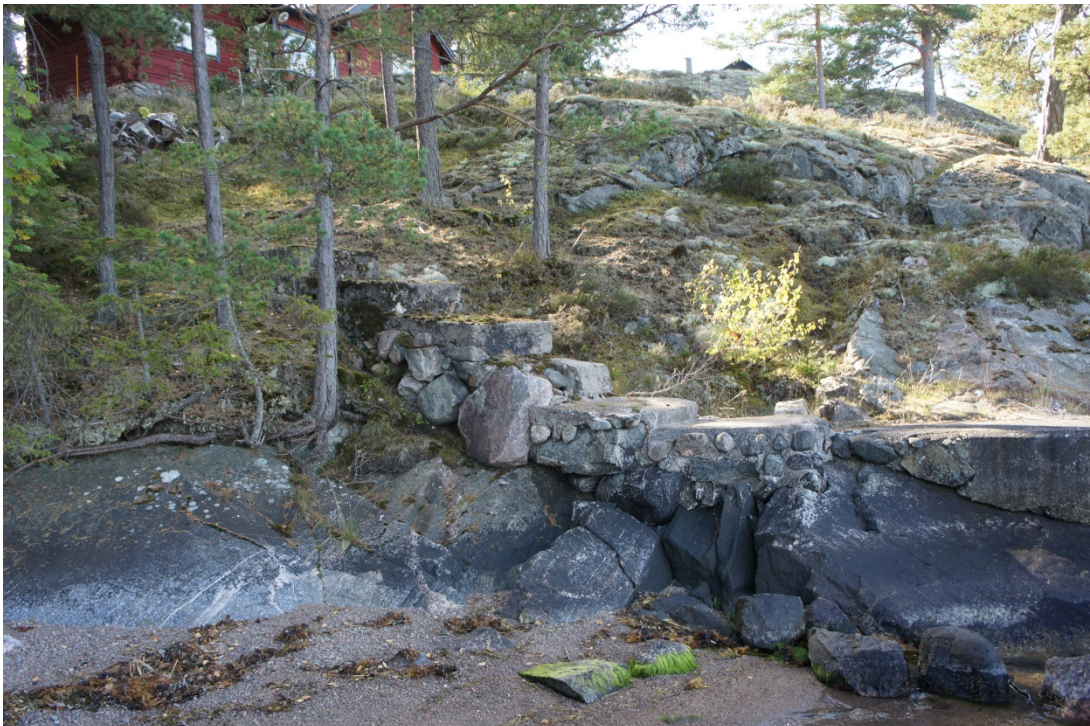
Stentrappan upp mot huvudbyggnaden