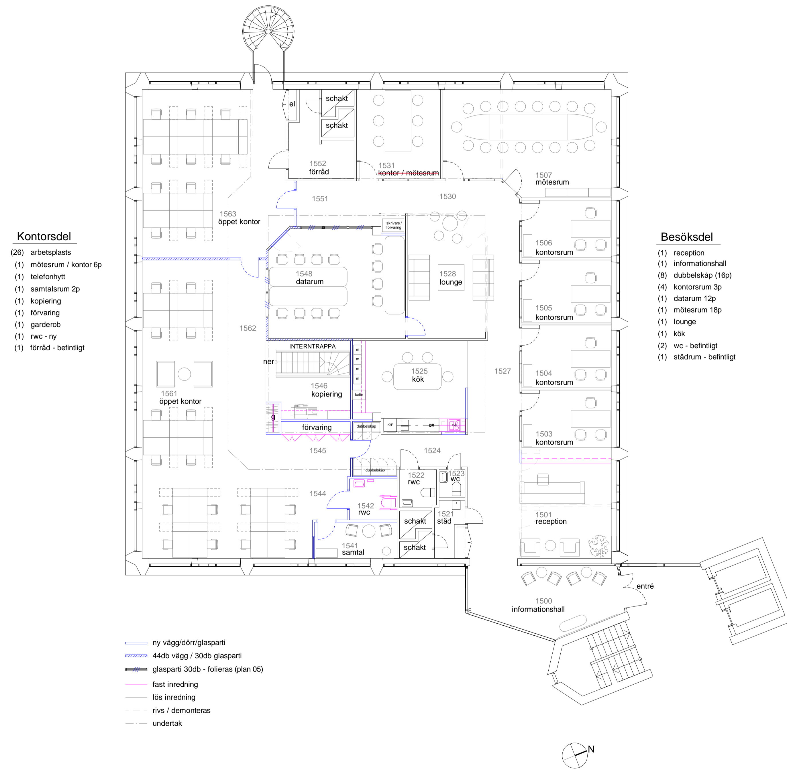
PLAN 5 Skala: 1:100 (A1) Hus 1. Heliosgatan 26.