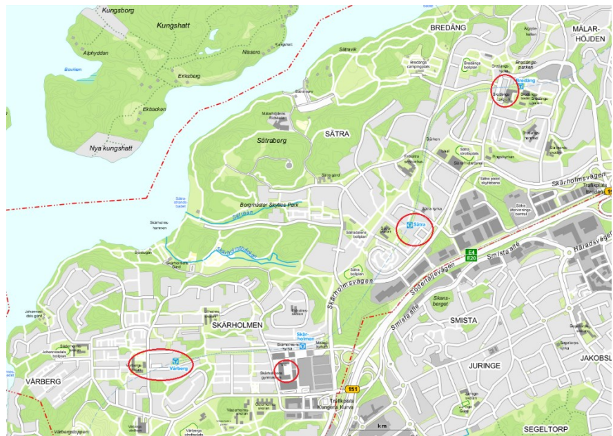
Kartutsnitt med centrummiljöer inringade.

Stadsdelsområdets fyra centrummiljöer; Vårberg, Skärholmen, Sättra och Bredäng.