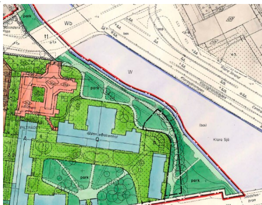
Serafimerstranden. Dp 6958. (1981)

Kontoret kan konstatera att de nu föreslagna platserna alla är detaljplanelagda som park- eller naturmark. Där broarna är finns dock också planstöd för att bro får uppföras.