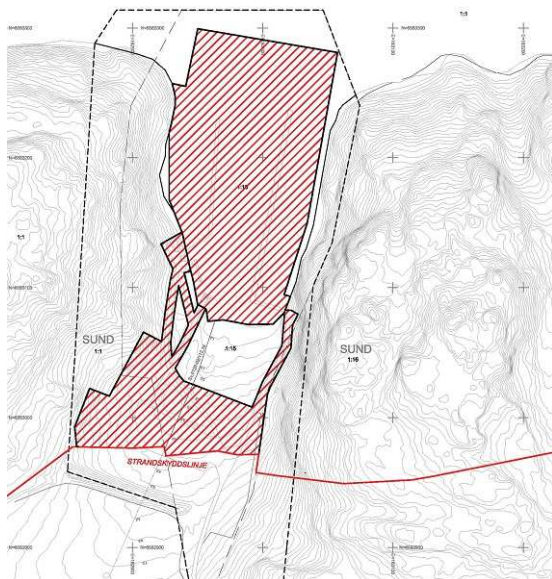
Karta 2. De delar av planområdet som berörs av strandskyddet markeras i rött.

Vid området kring marinan gäller 300 m strandskydd. Strandskyddet är sedan tidigare upphävt vid marinan, men planförslaget kommer ändå kräva en ny prövning av strandskyddsdispens, då strandskydd på 100 m automatiskt återinträder när befintlig plan upphör. De delar av planområdet som berörs av strandskyddet illustreras i karta 2. Om strandskyddsdispens inte medges kan planförslaget inte genomföras.