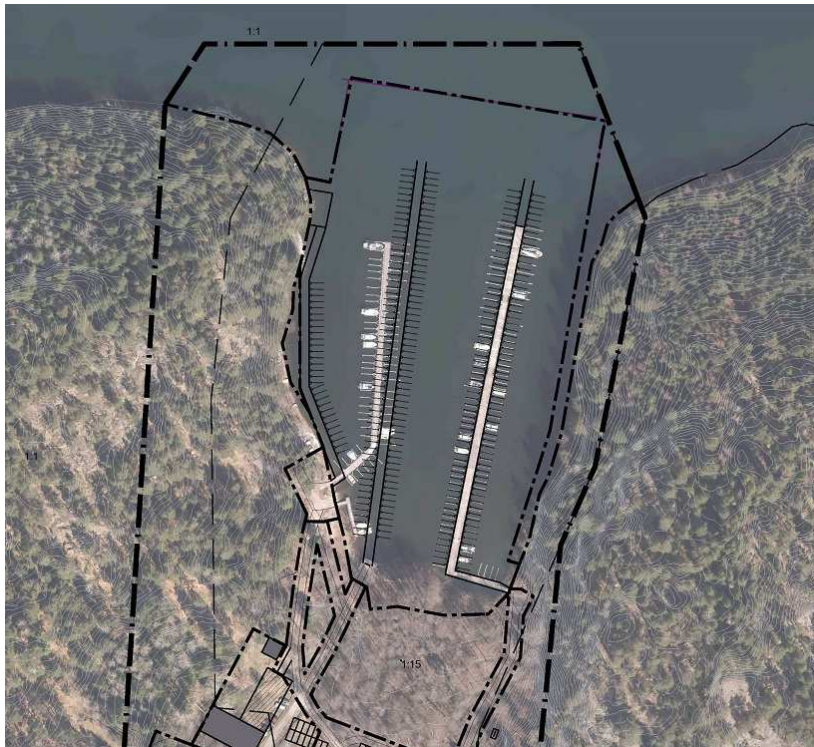
Figur 1. Bryggornas placering i Stora Räfsevik. Planerad framtida planering illustrerat i svart.