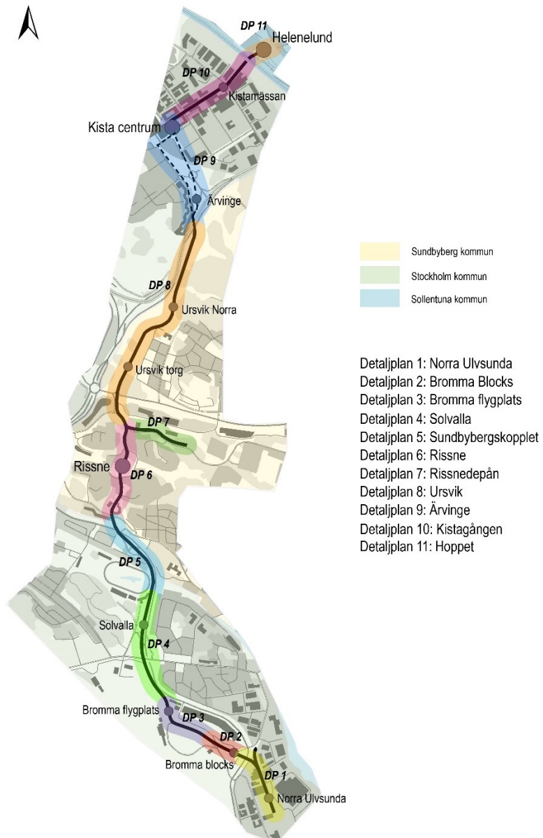
Bild 1. Kistagrenens detaljplaneindelning i Stockholm, Sundbyberg och Sollentuna

kommunfullmäktige samtidigt som detaljplanen. Genomförandeavtalet reglerar ansvarsförhållandena mellan SL och staden vid utbyggnaden av sträckan inom detaljplanen för Norra Ulvsunda industriområde. Genomförandeavtalet är det första av totalt sju som ska tecknas för hela sträckan inom staden.