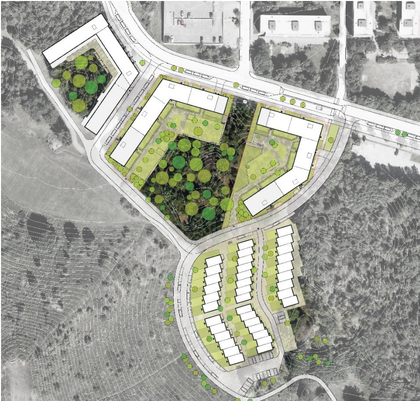
Figur 3. Situationsplan, planerad bebyggelse.