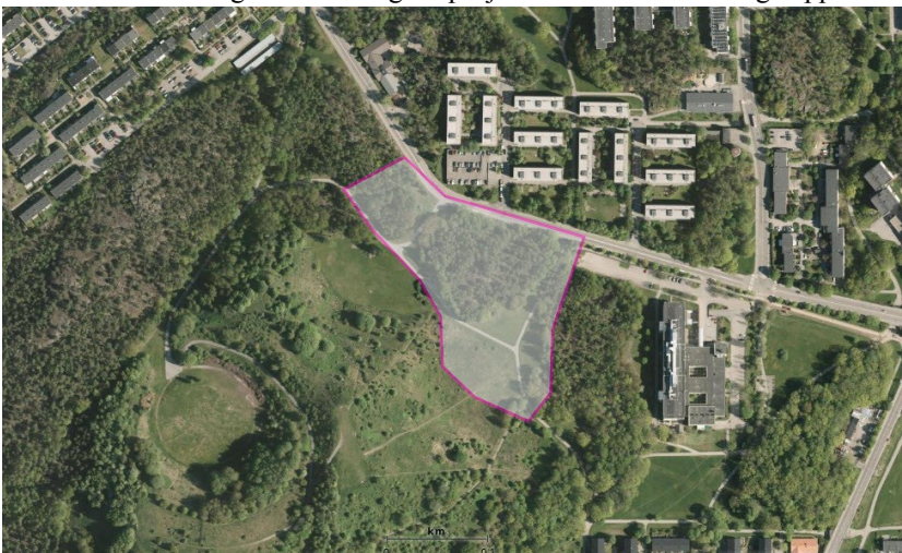
Figur 1. Flygfoto över aktuellt projektområde invid Vårbergsvägen markerat, åt sydväst i bild skimtar naturområdet Vårbergstoppen.

till det mindre projektområdet Söderholmen, samt i sydväst invid naturområdet Vårbergstoppen, se figur 1. Här har markanvisning för bostäder givits år 2015 till Åke Sundvall Projekt AB (område B1 och B2 i figur 2) samt till Wästbygg Projektutveckling i Stockholm AB (område A i figur 2). Exploateringsnämnden har sedan tidigare, efter en markanvisningstävling år 2010 lämnat markanvisning till Sjaelsö Sverige AB för uppförande av 40 radhuslägenheter inom ungefärligt område C i figur 2. Då bolaget gick i konkurs gjordes en ny markanvisning av radhuslägenheter år 2013 till Wästbygg Projektutveckling i Stockholm AB på samma plats. Samtliga dessa markanvisningsområden ingår i projektområdet för Vårbergstoppen.