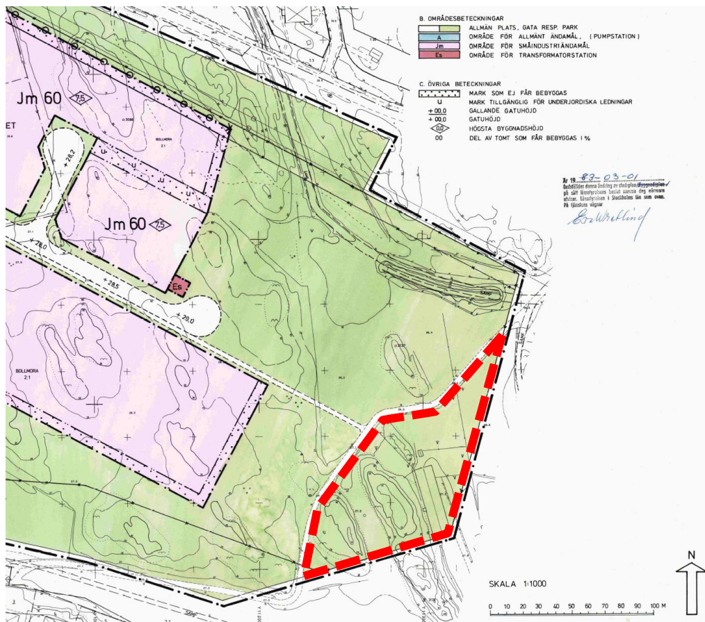
Området för upphävandet inom detaljplan 199, inringat med röstreckad linje

Upphävande av del av gällande detaljplan på den östra sidan av Fårdala gårdsväg innebär att utbyggnaden av stallet kan prövas av bygglov utifrån naturreservats förutsättningar.