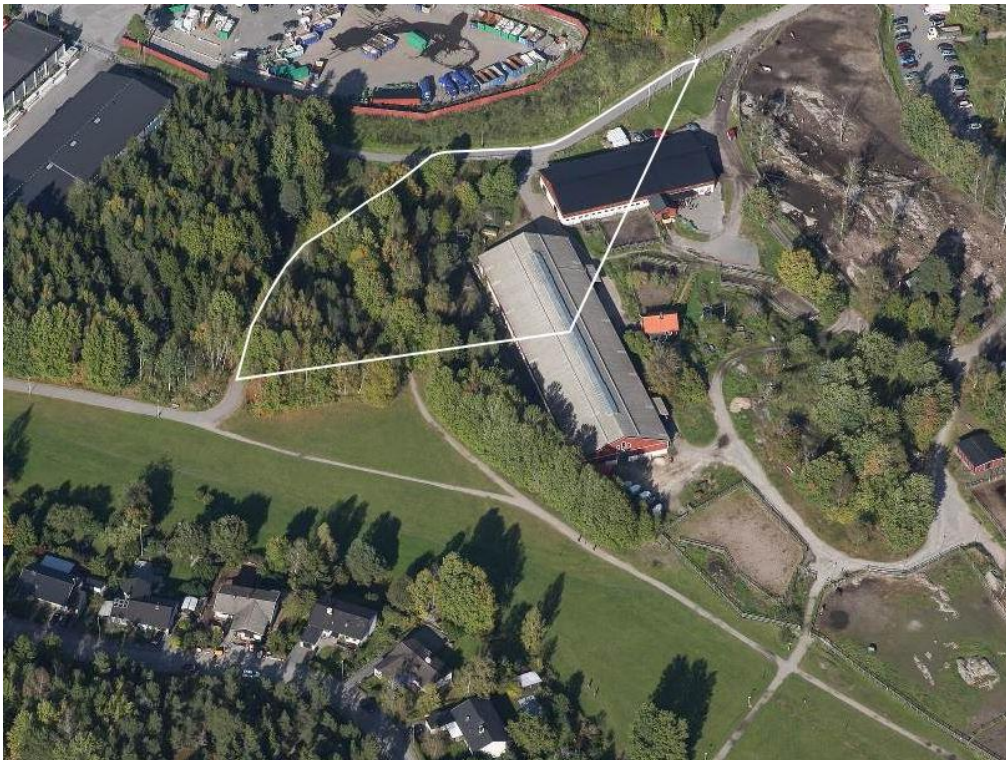
Flygbild där vit linje visar området för upphävandet

Området som ska upphävas är beläget i Petterboda/Fårdala, söder om Tyresövägen och öster om Fårdala gårdsväg.