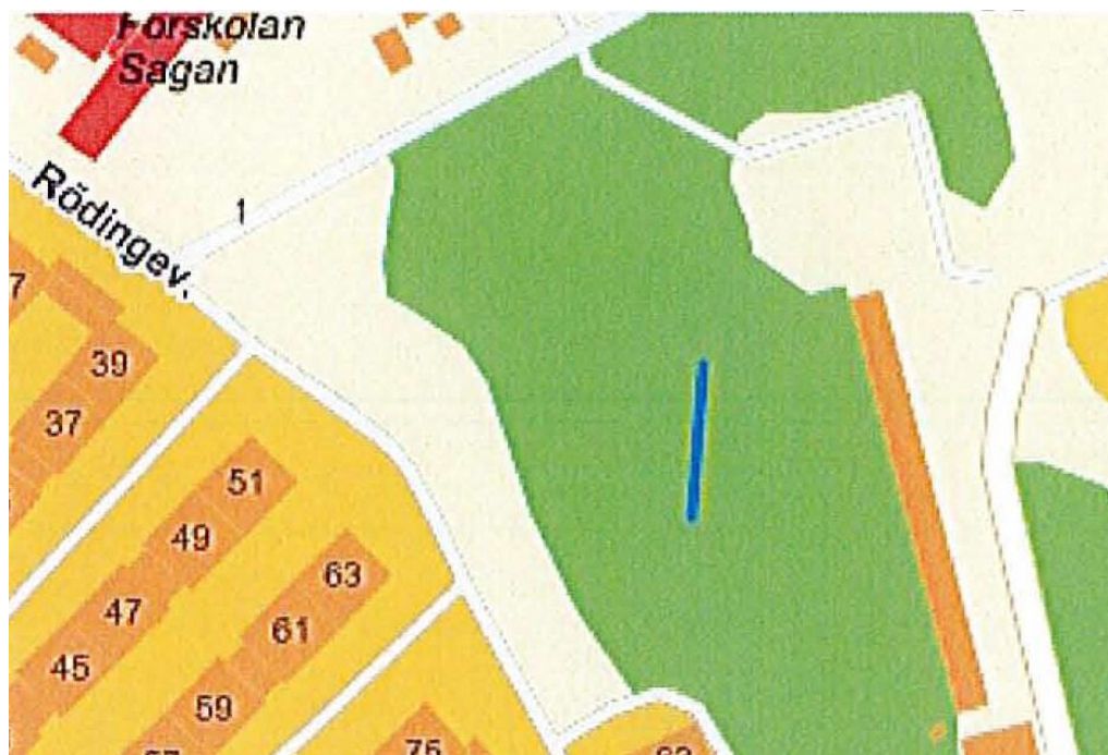
Bifogad bild med blåsippornas läge markerat med ett blått streck.

Jag föreslår att planeringen tar hänsyn till att blåsipporna ska kunna fortsätta finnas på förskolans område genom någon form av inhägnad för blåsippstället, gärna med en liten skylt.