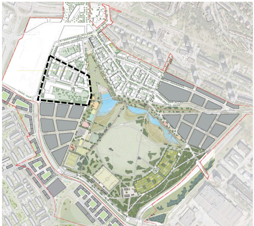
Figur 1: Illustrationsplan över Årstafältet, etapp 3 inom streckad linje.

Årstafältet är ett stort stadsutvecklingsprojekt som syftar till att omvandla Årstafältet till en tät stadsbebyggelse med nya bostäder, handel, mötesplats och offentliga rum samt en stor stadsdelspark med dagvattendammar och aktivitetsbrygga. Projektet består av nio etapper som planeras att bebyggas med cirka 6 000 nya bostäder mellan år 2020 och 2030. Etapp 3 planeras att bebyggas mellan år 2020 och 2023 med en inflytt åren 2022-2023.