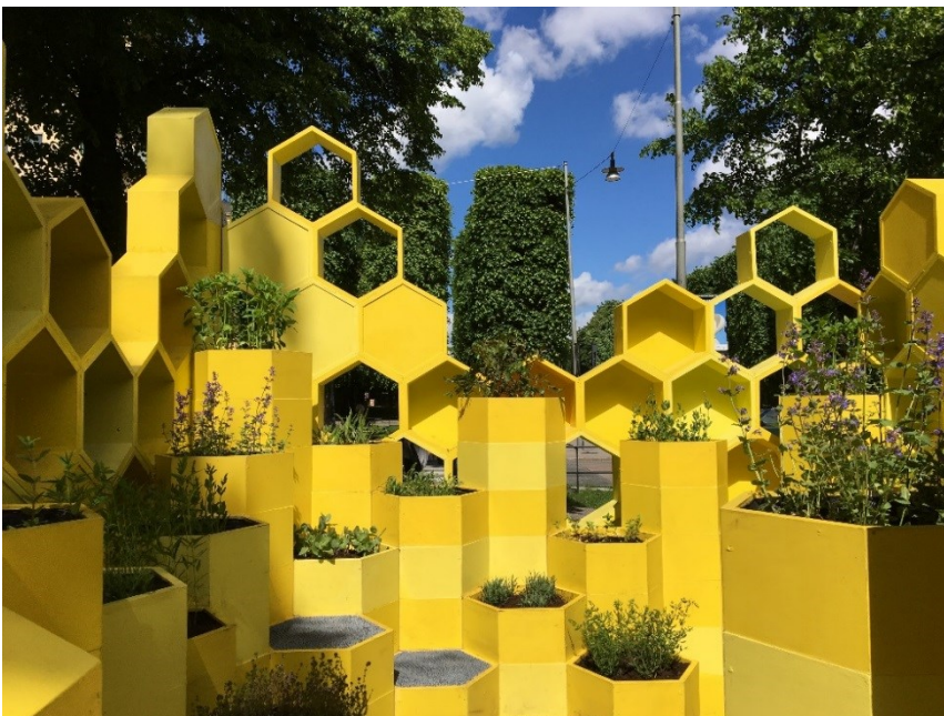
Installationen Bee Connected östra Valhallavägen sommaren 2017, framtagen av C/O City

I parken fanns även installationen Bee Connected som tagits fram av Chalmers och White arkitekter inom ramen för projektet C/O city och som på ett pedagogiskt sätt informerar om betydelsen av bin och pollinering i staden.