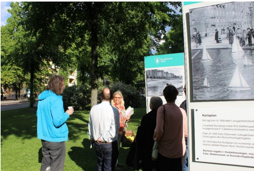
Visning av fotoutställningen i östra Valhallavägens pop up-park, invigning 14 juni