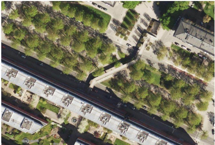
Platsen för östra Valhallavägens pop up-park, mittstråket av Valhallavägen mellan Erik Dahlbergsgatan och Värtavägen.