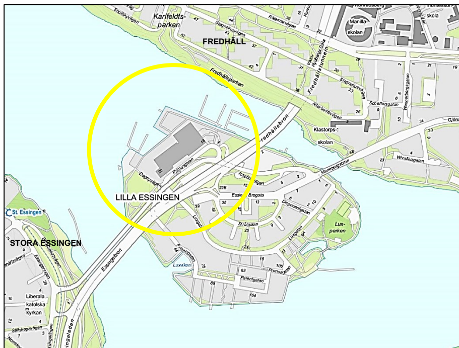
Översiktskarta med planområdets ungefärliga läge markerat.