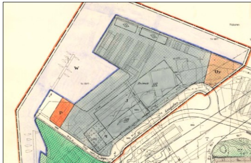
Illustration över vad som är allmän plats park (grön färg) och vad som är privatägd kvartersmark (grå, röd och rosa färg) i gällande detaljplan vid Primushamnen, Östra Primusparken samt strandzonen mot Fredhäll. Redovisad plan är stadsplan för del av stadsdelen Lilla Essingen (PI 5750), fastställd 1961).

Stadsbyggnadskontoret vill betona att delar av det som idag uppfattas som allmänt tillgängliga parkmiljöer längs vattnet, Östra Primusparken exempelvis, egentligen är privatägd kvartersmark som saknar skydd för befintlig vegetation och garanti för allmänhetens tillgänglighet. I den meningen är dessa delar inte en park utan ett informellt grönområde. I förslaget till detaljplan planläggs Östra Primusparken samt övriga ytor längs vattnet som allmän platsmark, huvudsakligen park, med kommunalt huvudmannaskap och säkras därmed för framtiden. Se även bilder nedan.