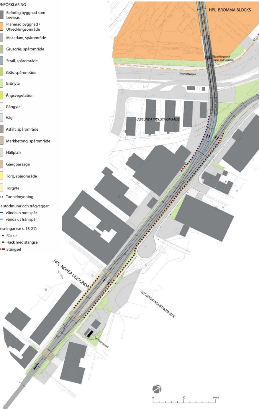
Illustration över Tvärbanan vid Ulvsunda industriområde och avgreningen från den befintliga Solnagrenen.