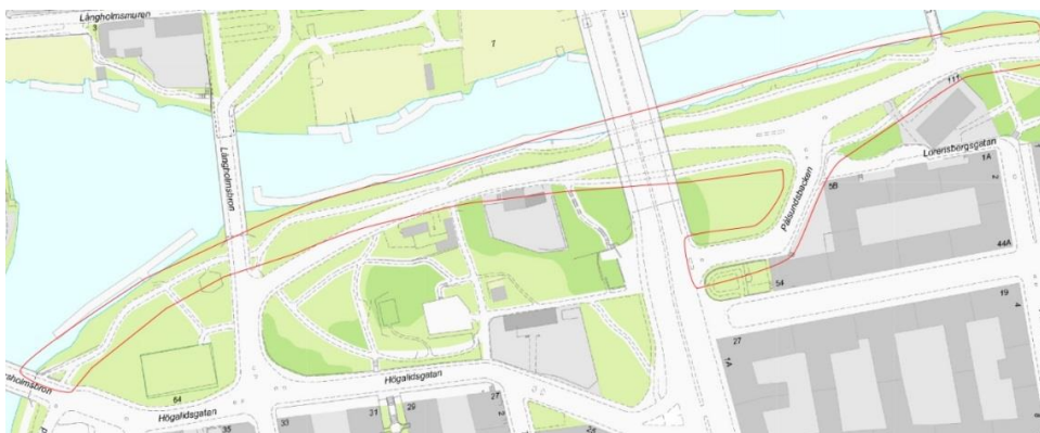
Figur 1. Avgränsning av utbreddningsområde, Söder Mälarstrand (Karta: Stockholm stad).

Hösten 2014 påbörjades arbete med en Systemhandling för projektet. Staden visste sedan tidigare att det varit problem med stabiliteten i området då rörelser i marken gjorde att trafiken fick stängas av i samband med utförandet av gång- och cykelbanan öster om Pålsundsbron. Med anledning härav inleddes en geoteknisk undersökning för att kunna bedöma stabiliteten för föreslagna breddningar och nya stödmurar.