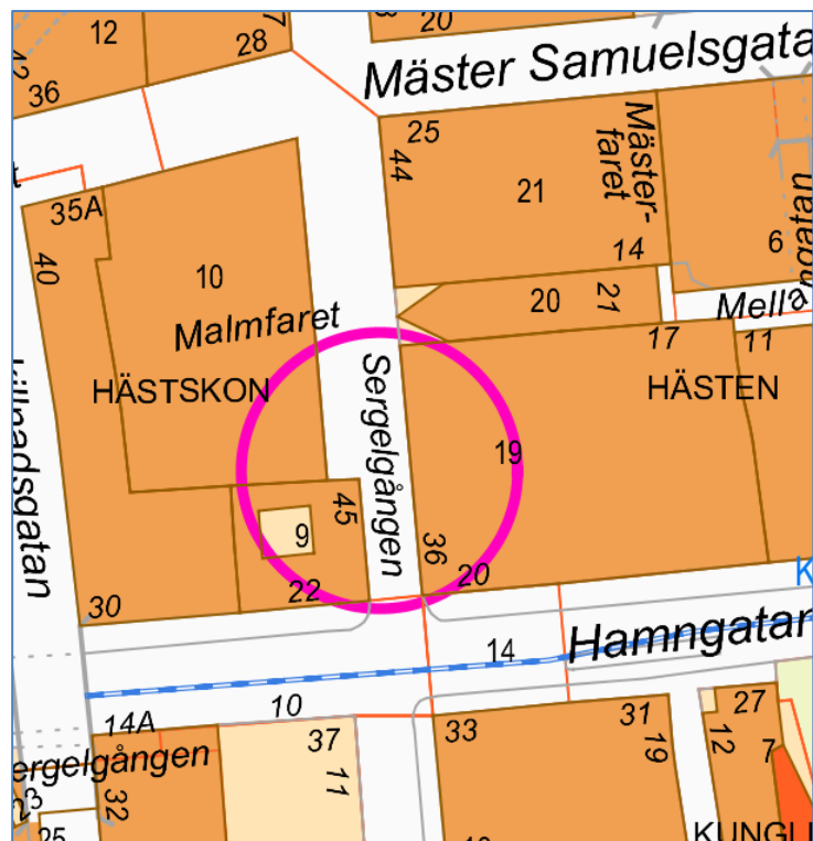
Översikt av området

Bebyggelsen utgörs av en underjordisk förbindelselänk under Regeringsgatan mellan parkeringshuset Parkaden och varuhuset NK, dvs mellan Hästen 19 och Hästskon 10. Förbindelselänken nyttjas dels för distributionstrafik samt försäljnings- och lagerlokal.