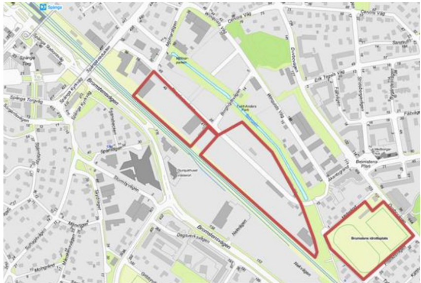
Figur 1 Området ligger i västra Stockholm i Bromsten nära Spånga station. Bilden visar den del (etapp 2) som omfattas av detaljplanen för kvarteren Gustav och Gunhild, tillika det föreslagna genomförandebeslutet.

detaljplaneprogram fram för att utreda områdets förutsättningar för bostäder och arbetsplatser vilket har resulterat i en detaljplan för kvarteret Tora mfl (etapp 1) samt ytterligare en detaljplan för kvarteren Gustav och Gunhild (etapp 2). Området, som i framtidsvisionen kallas Bromstensstaden, planeras innehålla bostäder med kommersiella lokaler i bottenvåning, förskolor, en skola, en ny park och en omdanad Bällsta å som är en central resurs för området.