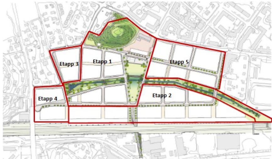
Figur 2. Bilden visar hur bostadsutvecklingen av Bromstensstaden skulle kunna ske. Ettapp 3-5 kan delas upp i fler etapper och i en annan följd.