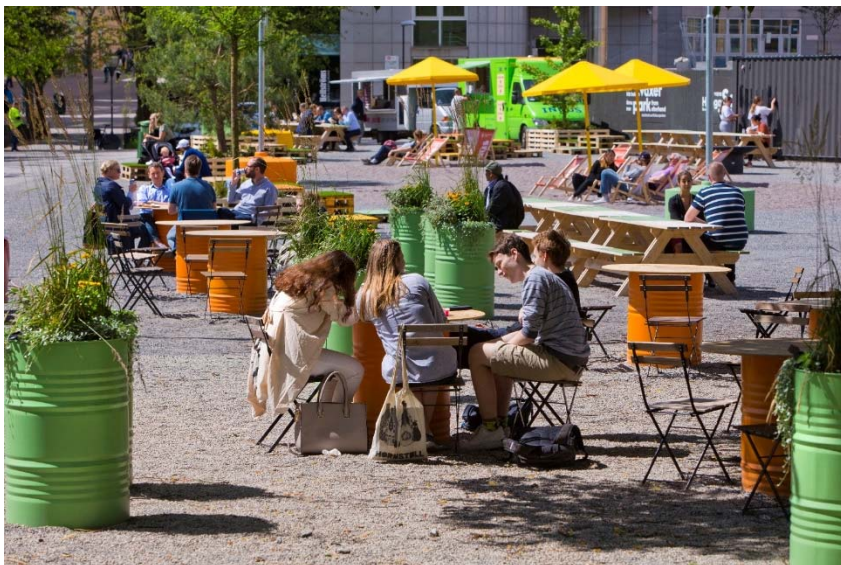
Figur 5. Popup-parken i Fatbursparken 2017 - 2018

Medan förberedelser pågår inför anläggande av den ”nya” parken har staden i samarbete med trafikkontoret och Södermalms stadsdelsförvaltning genom projektet Levande Stockholm projekterat och utfört en s k Popup-park norr om gångstråket i mitten av Fatbursparken under våren 2017. Parken invigdes i juni och kommer att vara på plats under vintern 2017/18 samt t o m sommaren 2018. Se figur 5 nedan.