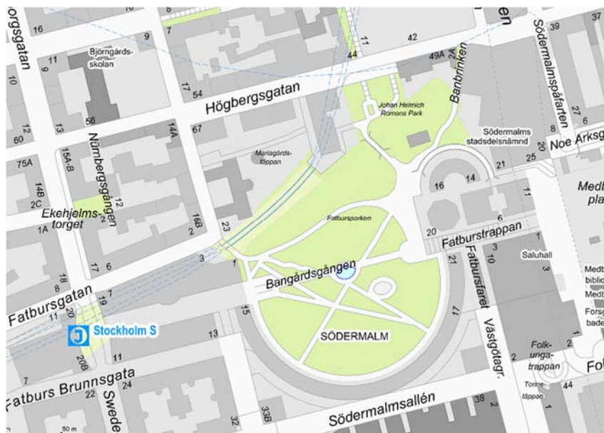
Figur 1. Fatbursparken och Romans park

upprustning av Fatbursparken efter en av staden föreslagen och av projekt Citybanan utförd överdäckning av den befintliga järnvägen vid den nordvästra delen av parken, kallad Mariagårdstäppan. Dels en bostadsexploatering i Johan Helmich Romans Park i norra delen av parken med en omfattning på ca 65-75 lägenheter i bostadsrätt. Projektet har redovisats flera gånger i gatu- och fastighetsnämnden/marknämnden/ exploateringsnämnden. De aktuella förutsättningarna för projektet redovisas nedan.