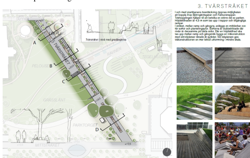
Figur 4. Det planerade Tvärstråket i Fatbursparken

Av konstruktionsmässiga skäl kommer det endast vara möjligt att planera träd inom vissa ytor i den underbyggda parken men huvudsakligen blir det fråga om öppna gräsytor med buskar och planteringar och med ett tvärstråk med trappor och ramper som sträcker sig från Mittstråket upp till det nordvästra hörnet där det föreslås bli en lekplats. Se figur 4 nedan.