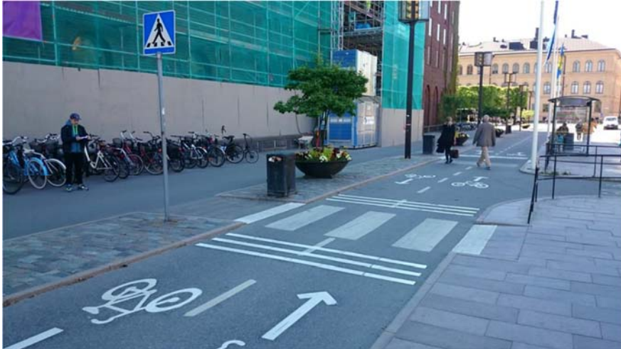
Stadshuset efter åtgärd.

Projektet visade att kollisioner mellan fotgängare och cyklister är ett relativt litet trafiksäkerhetsproblem, men att korsningspunkter mellan fotgängare och cyklister kan utgöra ett trygghets- och framkomlighetsproblem för såväl fotgängare som cyklister. Studierna visade också att det finns begränsade möjligheter att styra cyklister med de enkla åtgärder som studerades i projektet. Det krävs även arbete med övergripande planering, cykelkultur och attityder.