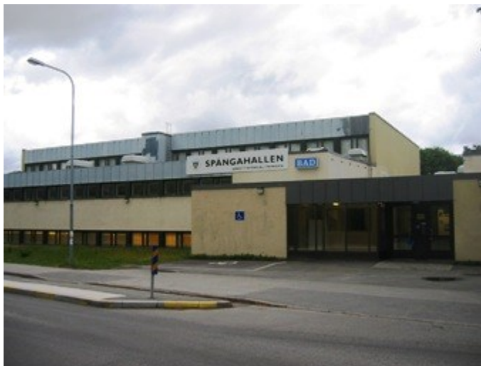
Spånga bad- och idrottshall