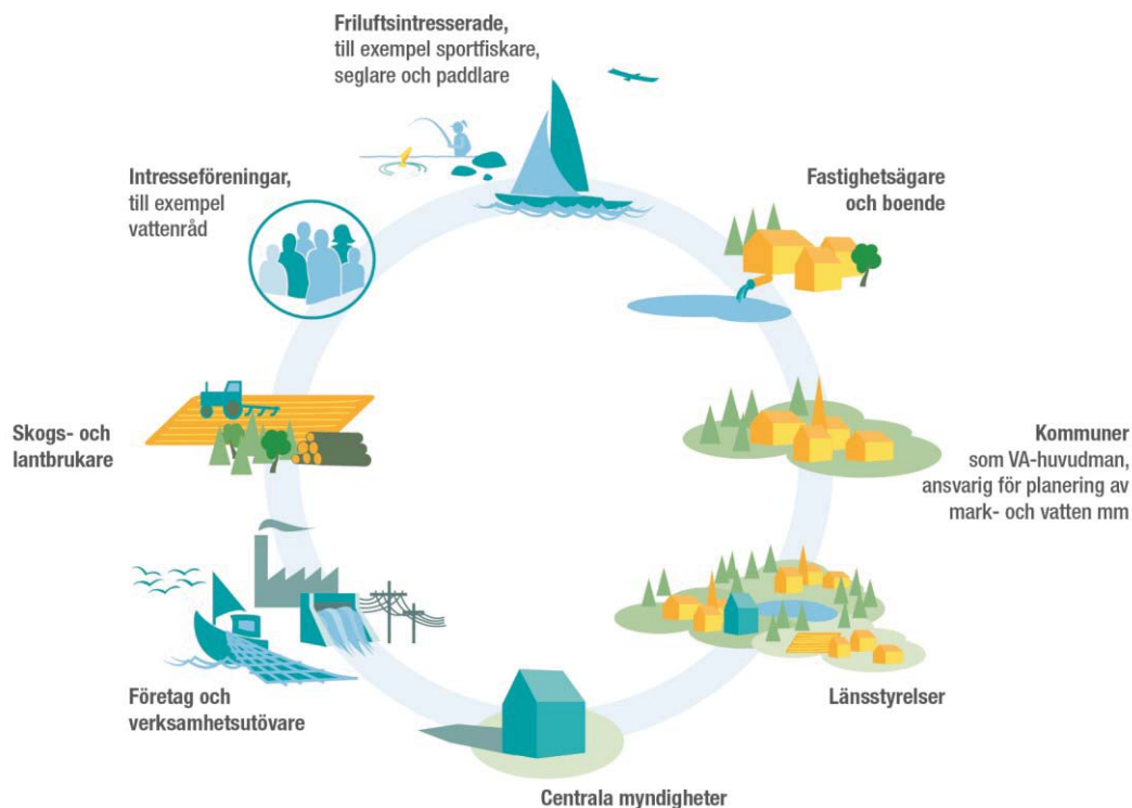
Figur 1. Vattenförvaltningsarbetet berör många aktörer i samhället. Vissa berörs främst genom att dra nytta av förbättrande insatser som genomförs i vattenmiljön. Andra främst som beslutsfattare eller genomförare av sådana insatser. Men gemensamt för alla är möjligheten att påverka arbetet genom att delta aktivt, till exempel vid samråd.

De centrala myndigheterna har viktiga ansvarsområden som berör vattenförvaltningen och flera myndigheter har ett utpekat ansvar för åtgärder i åtgärdsprogrammet, eller för framtagande av kunskapsunderlag som behövs för genomförandet av åtgärdsprogrammet.