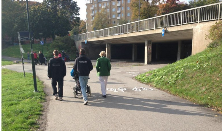
Figur 3. Delade gång- och cykelbanor i parken vid tunneln under Gjörwellsgatan innan ombyggnationen