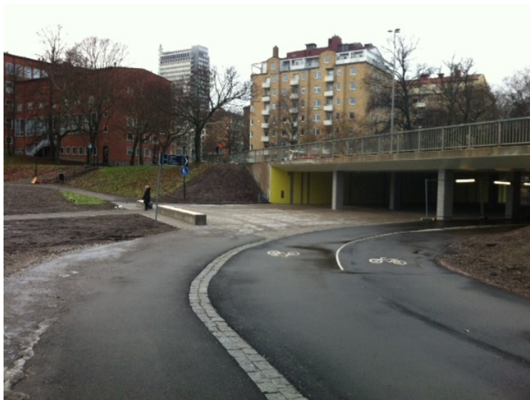
Figur 4. Delade gång- och cykelbanor i parken vid tunneln under Gjörwellsgatan efter ombyggnationen

Idag har det nya cykelstråket i parken samma bred (4,5 m) som på Norr Mälarstrand och Rålambshovsleden, vilket ger en bra och naturlig anslutning mellan stråkets bägge delar.