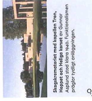
Skogskrematoriet med kapellen Tron, Hoppet och Helliga korset av Gunnar Asplund stod klara 1940. Funktionalismen präglar tydligt anläggningen.