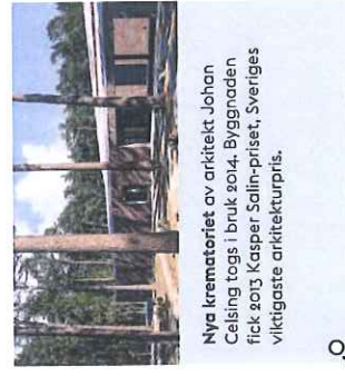
Nya krematoriet av arkitekt Johan Celsing togs i bruk 2014. Byggnaden fick 2015 Kasper Salin-priset, Sveriges viktigaste arkitekturpris.