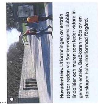
Huvudentrén. Utformningen av entrén startar redan vid Sockenvägens dubbla lindalléer och muren som leder vidare in genom entrén. Besökaren möts av en storslagen halvcirkelformad förgård.