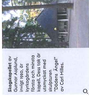
Skogskapellet av Gunnar Asplund, invigt 1920, är kyrkogårdens första och minsta kapell. Dess tak är utsmyckat med skulpturen "Dödens Ängel" av Carl Milles.