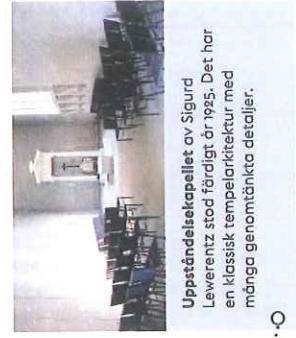
Uppståndelsekapellet av Sigurd Leverentz stod färdigt år 1925. Det har en klassisk tempelarkitektur med många genomtänkta detaljer.