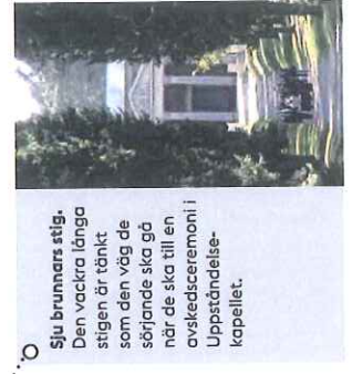
Sju brunners stig. Den vackra långa stigen är tänkt som den väg de sörjande ska gå när de ska till en avskedsceremoni i Uppståndelsekapellet.