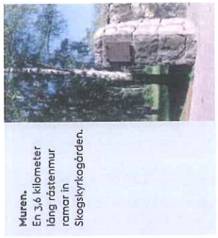
Muren. En 3,6 kilometer lång rätstenmur ramar in Skogskyrkogården.