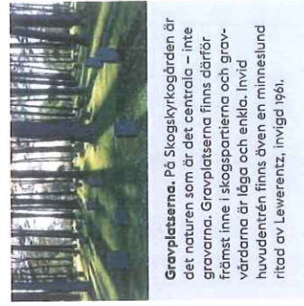
Gravplatserna. På Skogskyrkogården är det naturen som är det centrala – inte gravarna. Gravplatserna finns därför främst inne i skogspartierna och gravvärdarna är låga och enkla. Invigd huvudentrén finns även en minneslund ritad av Leverentz, invigd 1925.