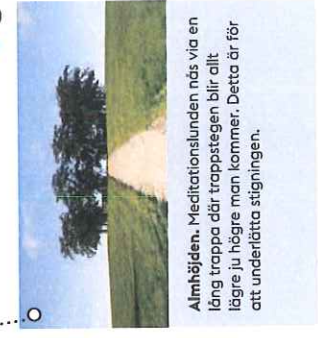
Almhöjden. Meditationslundan nås via en lång trappa där trappstegen blir allt lägre ju högre man kommer. Detta är för att underlätta stigningen.