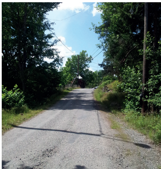
Befintligt gatunät inom planområdet.