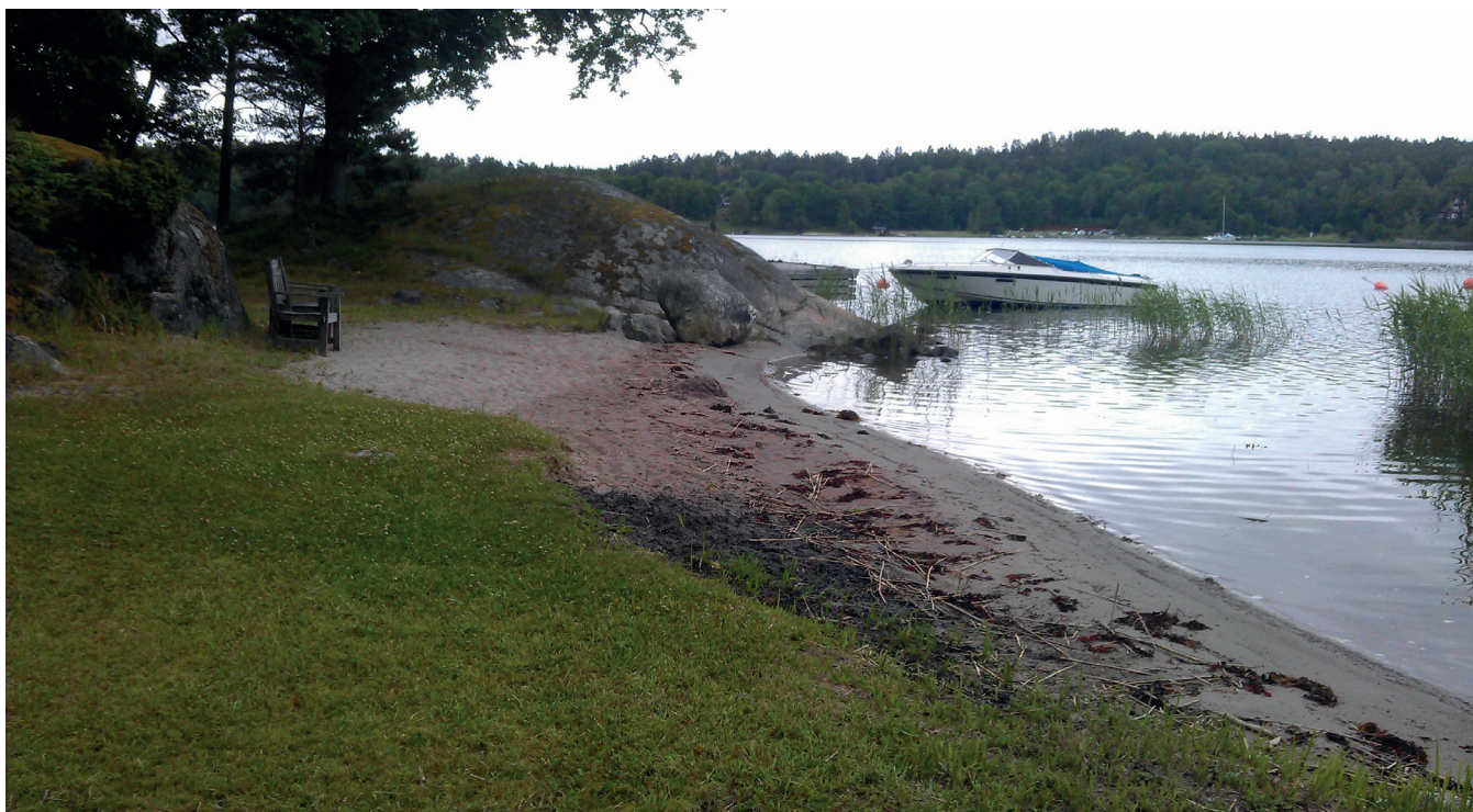
Badplats i Herrviksnäs

Planområdet nås via Stavsnäsvägen. Stavsnäsvägen är en statlig väg, där Trafikverket är väghållare, och del