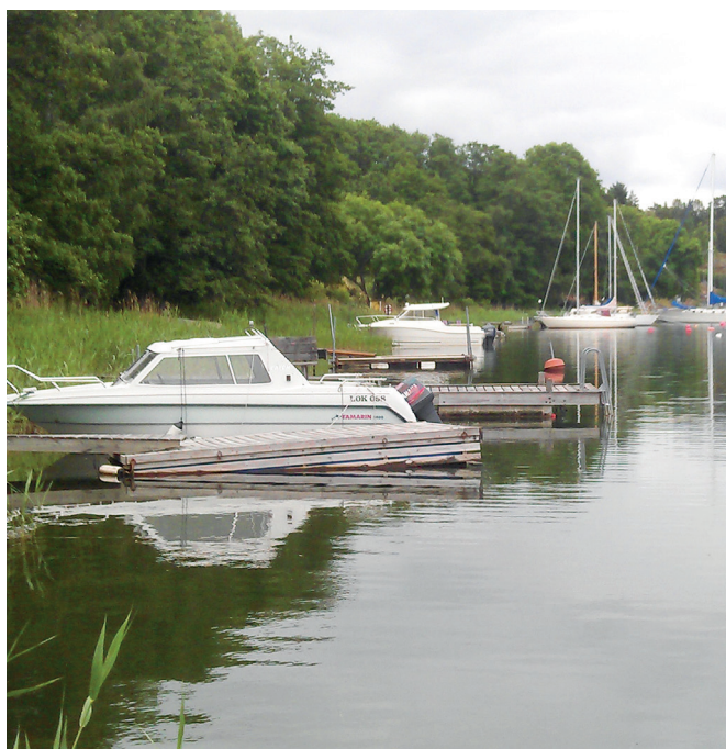
Befintligt bryggområde i Herrviken.

Planen definierar även specifika områden för båtverksamhet för att det i området inte ska bli ett ökat antal båtplatser i de grundare delarna som är mer känsliga för mänsklig påverkan. Förslag till gemensam brygga ligger angränsande till småbåtshamnen i Ryttinge där viken är djupare och mindre känslig för påverkan. Detaljplanens införande av kommunala VS-ledningar samt krav på anslutning minimerar risken för att avloppsvatten mynnar ut i viken vilket tidigare var en risk med gamla enskilda avlopp.