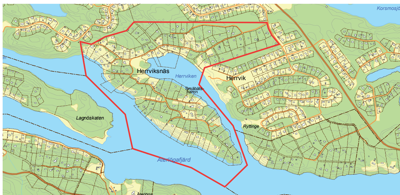
Illustration över område som i programmet kallas för Herrviksnäs, delområde S3.

Kommunstyrelsen (KS) fattade den 28 november 2017 beslut om att godkänna förslag till detaljplanen för Herrviksnäs delområde S3 för antagande.