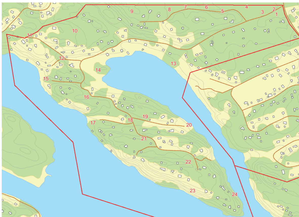
Kartan ovan visar olika naturområden i Herrviksnäs. Se bilaga Naturbeskrivning för mer information.

De bedömningar som gjorts i dagvattenutredningen respektive naturinventeringen har resulterat i att befintliga grönområden till största del bevaras. (Se Naturinventering, 2014 samt framtagen Dagvattenutredning, Sweco, 2013, för mer information). Några mindre ytor som möjliggör en liten utökning av den befintliga infartsparkeringen och två bostadsfastigheter tillförs i detaljplanen. Naturen kommer ändå även fortsättningsvis att vara sammanhängande.