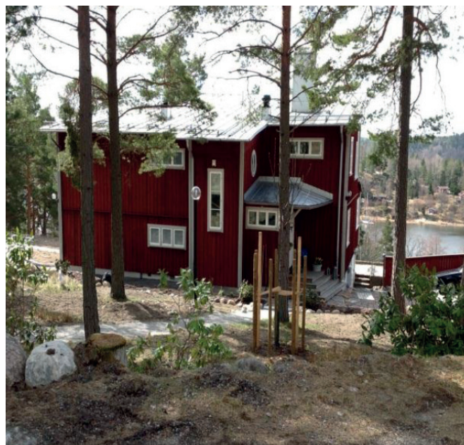
Bebyggelse i området

Minsta fastighetsstorlek är i huvudsak föreslagen till 2500 m 2 . Till fastighetsstorlek gäller endast fastigheters areal av land, inte vatten. Inom området finns varierande förutsättningar för befintliga fastigheter avseende storlek, topografi, tillgänglighetskrav och påverkan av strandskydd som alla påverkar möjligheterna till och lämpligheten för delning av fastigheter. En del befintliga fastigheter har en stor areal och därför är