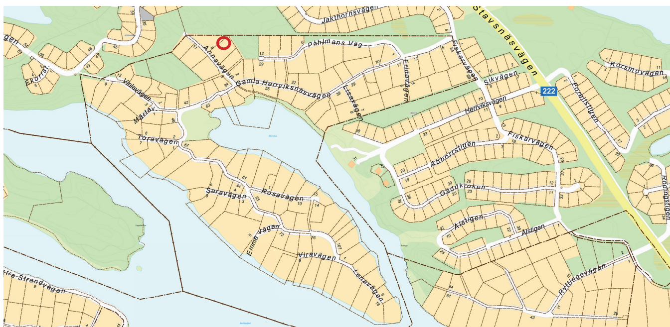
Figur 1. Ringen markerar ett instängt område inom planområdet för Herrviksnäs.

Området omfattas inte av någon bullerstörande källa.