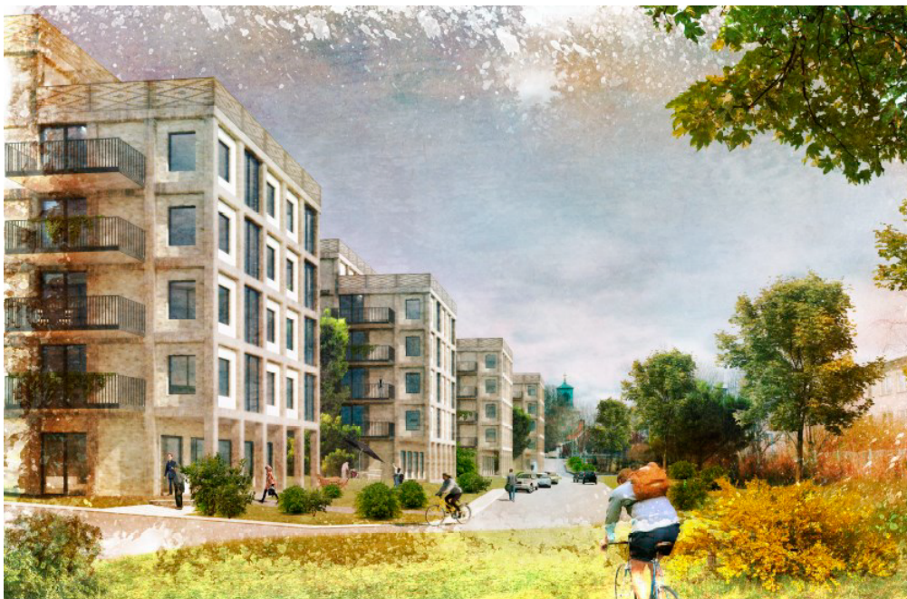
Föreslagen ny bostadsbebyggelse.

Totalt tillförs området ett kontorshus samt fyra bostadshus om i dagsläget 174 lägenheter. Befintlig bebyggelse (Kämpingeskolan) rivs och parkering ordnas i ett garage under de fyra bostadshusen. Bostäderna planeras nära Spånga by och kyrka och kyrkomiljön utgör en viktig länk mellan traktens äldsta historia och nutiden. Det har varit viktigt att de fyra bostadshusen trappas upp i etapper från den låga bebyggelsen i söder mot den högre i norr för att inte störa kulturmiljön utan anpassa sig till omkringliggande bebyggelse på ett lyhört och mjukt sätt. Stor del av planområdet blir parkmark och strävan har varit att låta det gröna växa ner mellan husen.