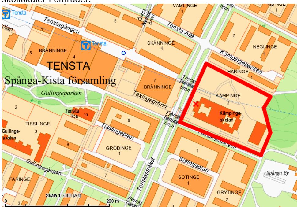
Aktuellt planområde markerat med rött

På fastigheten idag finns den nedlagda skolan Kämpingskolan vilken Skolfastigheter i Stockholm AB, SISAB, förvaltar och det finns idag ett överskott av skollokaler i området.