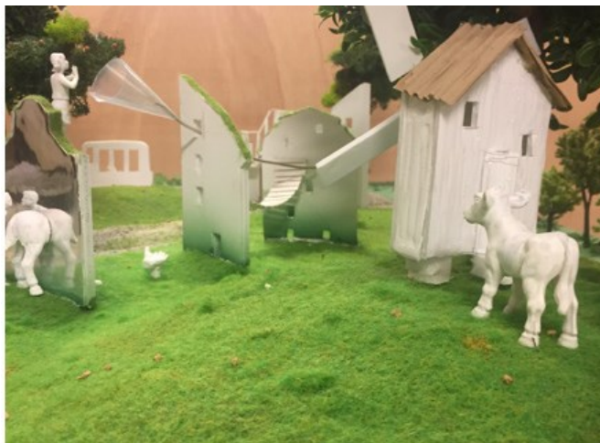
Kullen med väderkvarn och sekvensen av fasader i olika arkitekturstilar.