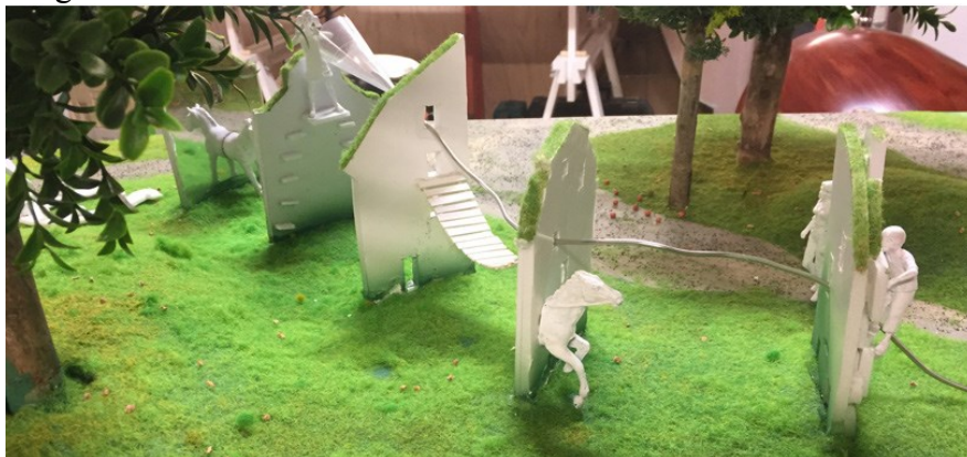
”Tidsresan”, en sekvens av fem olika fasader i olika arkitekturstilar.

Förslagets kreativa avstamp är därför att arbeta med tidstypiska husgavlar från 1600-talet fram till idag för att skapa en tidsresa där man kan börja i 1600-talet och leka sig fram till nutid. Installationen programmeras med olika lekfunktioner på, genom och mellan husgavlarna.