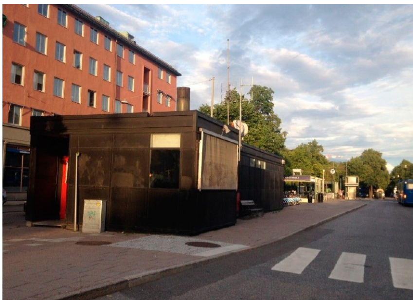
Personalbyggnaden är uppförd i ett plan i svart plåt med platt tak, cirka 100 kvm stor. I bakgrunden skymtas tunnelbanenedgången till station Tekniska högskolan.

Planförslaget innebär ingen förändring av den byggda miljön. Genom en ändringsbestämmelse kan byggrätt skapas samtidigt som marken fortsatt är allmän plats med staden som huvudman. Ändringsplanen gäller tillsammans med underliggande detaljplan och möjliggör att byggnaden kan stå kvar så länge staden bedömer det som lämpligt. Egenskapsbestämmelsen personallokal medger byggrätt i ett plan om högst 100 kvm. Detta överensstämmer med befintlig byggnad på platsen. Med stöd av denna ändringsplan kan bygglov beviljas utan tidsgräns.