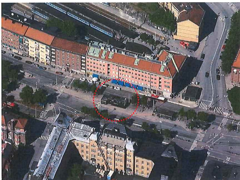
Personalbyggnadens läge på Valhallavägen vid Östra station.

Personalbyggnaden, med adress Valhallavägen 77A, är belägen på gatumark mellan körbanorna på Valhallavägen. Byggnaden är en del i den bussterminal som ligger i anslutning till tunnelbanestationen Tekniska högskolan samt järnvägsstationen Östra station för Roslagsbanan.