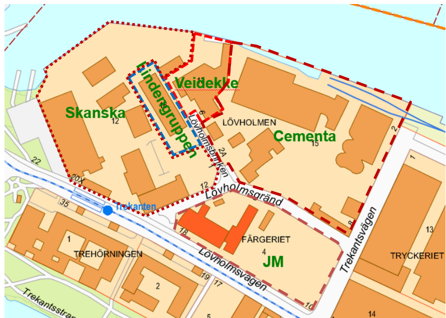
Kartbild med fastighetsägare.

Planområdet omfattar fastigheterna Liljeholmen 1:1 (Stockholm stad), Lövholmen 12 (Skanska), Lövholmen 13 (Veidekke), Lövholmen 15 (Fastighets AB Lövholmen), Lövholmen 16 (Lindengruppen AB) och Färgeriet 4 (JM). Sjöfastigheterna Liljeholmen 3:9 (Fastighets AB Lövholmen), Liljeholmen 1:S (uppgifter saknas), Liljeholmen 3:10 (Skanska), Liljeholmen 3:11 (Skanska) och Liljeholmen 3:12 (Skanska) ingår helt eller delvis i planområdet. Området är huvudsakligen privatägt. Cementa äger genom Fastighets AB Lövholmen fastigheten Lövholmen 15. Järntorget och Besqab har, genom det gemensamma bolaget JärnBesq Holding AB avtalat med ägaren till Lövholmen 15 om att förvärva fastigheten.