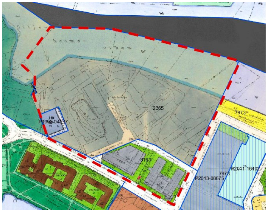
Planmosaik. Ungefärligt planområde markerat i rött.