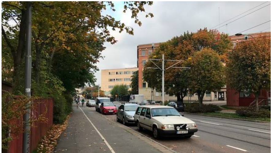
Lövholmsvägen idag.

I översiktsplanen för Stockholm (laga kraft vunen 23 mars 2018) är Lövholmen utpekad som stadsutvecklingsområde, strax utanför tullarna, som ska tillvarata den centrala stadens attraktionskraft. Ett övergripande mål är att skapa täta och attraktiva stadsdelar med blandat innehåll och offentliga miljöer av hög kvalitet, samt att planera för en sammanhållen, tät och levande stadsmiljö.