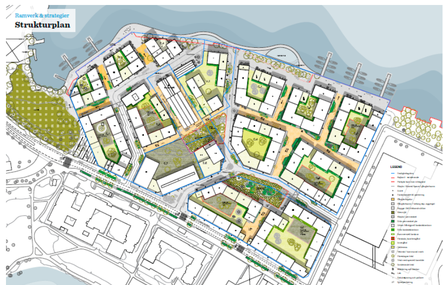
Strukturplan över Lövholmen. Bild: Gehl Architects.

I linje med stadens översiktsplan redovisas ett förslag till ny bebyggelse som innebär en sammanhållen, tät och levande stadsmiljö. Målet är att skapa en attraktiv stadsdel med blandat innehåll och offentliga miljöer av hög kvalitet.