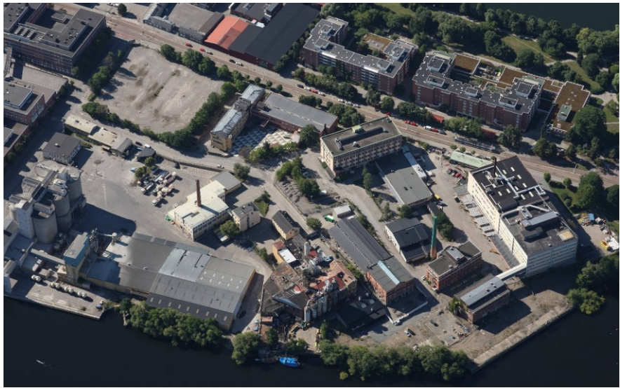
Flygfoto av Lövholmen från norr.