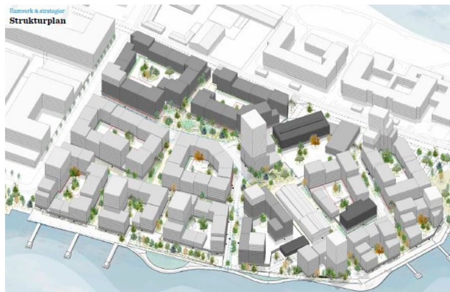
Föreslagna volymer enligt strukturplanen över Lövholmen. Bild: Gehl Architects.

Två nya parker föreslås i området. De är placerade i områdets kärna. I visionen utgör de komplement till förskolornas gårdar. Ett par mindre torg bildas där gångfartsgatorna och kajen vidgas. Kajerna öppnas upp och binder samman kajstråket mellan Gröndal och Marievik. På kajen samsas gående och biltrafik. Om det är möjligt kan kajen kompletteras med brygg- och kajanläggning i vattnet för att ytterligare möjliggöra för vistelse vid vattnet. Utbyggnad av en del av kajen är nödvändig för att klara angöring av kvarter i den västra delen.