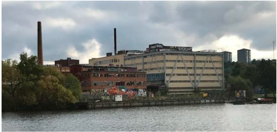
Del av planområdet sett från Reimersholme.