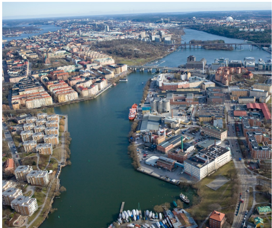
Vy över Lövholmen, Hornstull och Reimersholme.

Omfattning och avgränsning av miljökonsekvensbeskrivningen ska stämmas av med länsstyrelsen under det tidiga samrådet. De mest väsentliga nyckelfrågor, utöver de som behöver utredas med MKB, samt behov av fortsatta utredningar i kommande arbete med detaljplanen beskrivs nedan.