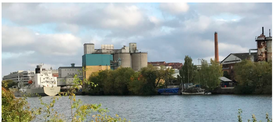
Del av planområdet sett från Hornstull.

Planområdet är lokaliserat i stadsdelen Liljeholmen och omfattar cirka 72 000 kvm. Området avgränsas av Liljeholmsviken i norr, Lövholmsvägen i söder, stadsdelen Gröndal i väster och Trekantsvägen i öster.