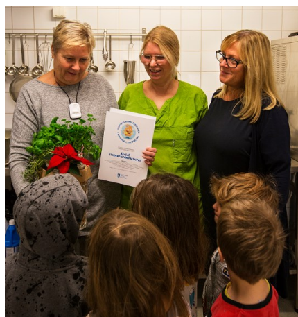
Förskolan Rödkulla, Älvsjö sdf. Vinnare2017

Tävlingen startades i syfte att uppmuntra och sporra stadens egna verksamheter och fastighetsbolag att börja matavfallssortera. Den går ut på att ha störst andel sophämtningsställen med matavfall. Tävlingsdeltagarna är indelade i två kategorier; stadsdelsförvaltningar och förvaltningar med minst 20 hämtställen och kommunala fastighetsbolag.