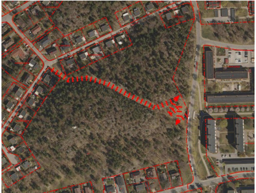
Parkvägssträcka Skogsslingan - Våruddsringen. Baskarta med ortofoto, samt avsedd parkvägssträcka markerad i rött.