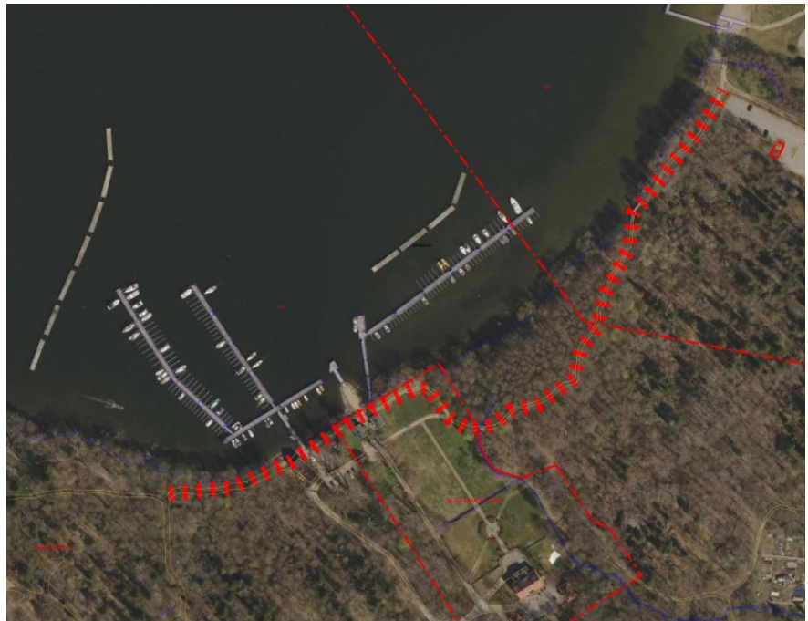
Parkvägssträcka Tusculum - Sättrastrandsbadet. Baskarta med ortofoto, samt avsedd parkvägssträcka markerad i rött.

Ungefär 100 meter av sträckan ligger på Skärholmens gård, som utgör en egen fastighet med Stadsholmen AB som tomträttsinnehavare. Även på denna fastighet saknas skräpkorgar. Vidare är sträckan svårtillgänglig med bil och kräver att parkdriften går från parkeringen vid Skärholmens koloniområde för att tömma eventuella skräpkorgar. Parkdriften tömmer varje vardag kring 100 av de totalt ca 350 skräpkorgar som finns i stadsdelsområdet, och en rationell drift är därmed en förutsättning för att upprätthålla nuvarande frekvens.