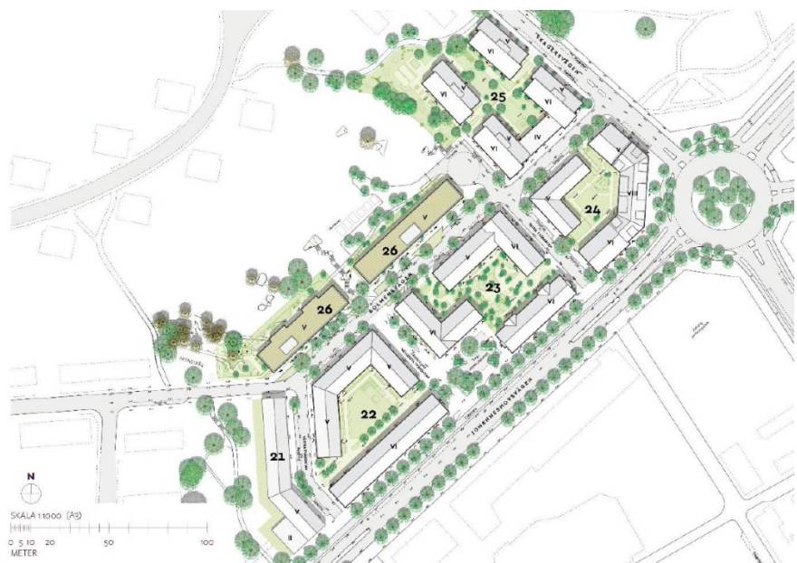
Figur 1: Illustrerad situationsplan med numrerade kvarter (21-26). Källa: samrådshandlingen för detaljplan Dnr 2015-20742.

Bebyggelsen närmast Johanneshovsvägen får en urban utformning med ett torg samt nya kopplingar mot naturmarken i planområdets norra del.