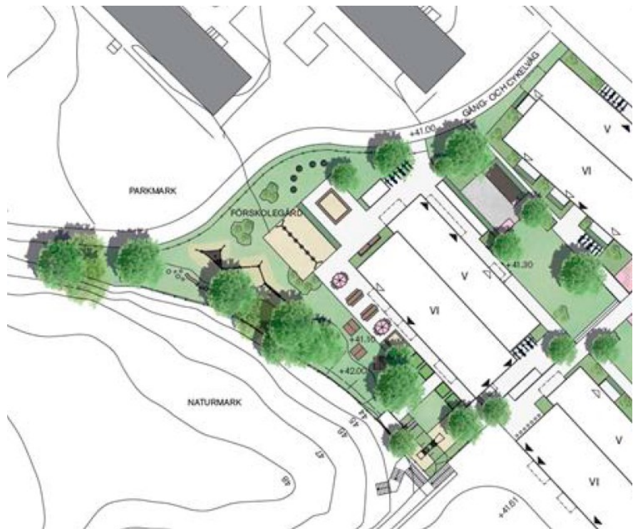
Figur 2: Illustrationsplan över förskolegård i kvarter 25. Källa: samrådshandling för detaljplan Dnr: 2015-20742.