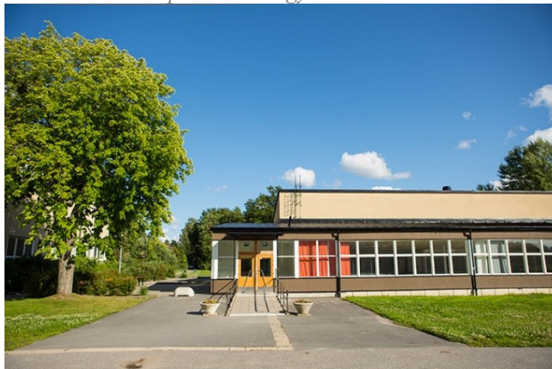
Bild 4. Matsalen på Bromma gymnasium.

Matsalen byggs ut för att utöka kapaciteten från dagens 212 personer till 412 personer efter utbyggnad. Detta avser teknisk kapacitet, som avgörs av bland annat ventilationen. I verkligheten används matsalen samtidigt av cirka 300 personer i dagsläget, trots att ventilationen inte är dimensionerad för detta. Entrén till matsalen byggs om för att klara av fler elever och skapa bättre flöden vid in- och utpassering. Matsalen byggs ut mot skolgårdssidan.