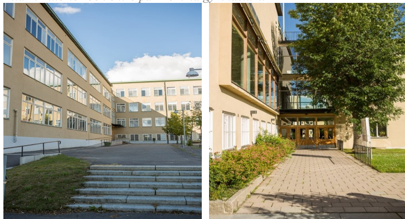
Bild 2. Exteriör och entré på Bromma gymnasium.

En ökning från dagens cirka 1100 till 1450 elever kan ske genom att ställa upp en så kallad konceptskola på en del av skolgården. Konceptskolan möjliggör för ytterligare 350 elever att gå på Bromma gymnasium. En konceptskola är en standardiserad byggnadstyp, framtagen av SISAB, som möjliggör en snabb etablering till en känd kostnad. Genom att inte ändra den arkitektoniska utformningen och genom att minimera de anpassningar som görs inuti byggnaden, hålls kostnaderna nere. Hitintills har SISAB satt upp ett antal konceptskolor för förskoleverksamhet. Nu ska byggnadstypen även användas för att öka kapaciteten på grund- och gymnasieskolor.