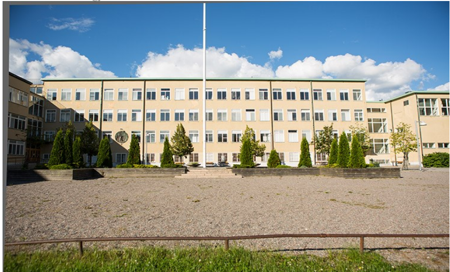
Bild 1. Bromma gymnasium.

Bromma gymnasium har ett söktryck som är i balans. Inför läsåret 2018/19 så har Bromma gymnasium 1,0 förstahandsökande per anmäld plats. Utöver det så har 948 ungdomar skolan som andra- eller tredjehandsalternativ. Skolans intag är till stor del lokalt. Flest elever är folkbokförda i stadsdelarna Bromma (333 elever) och Hässelby-Vällingby (255), följt av Ekerö kommun (136) och Spånga-Tensta (94). Läsåret 2018/19 var cirka 72 procent av skolans elever folkbokförda i Stockholm.