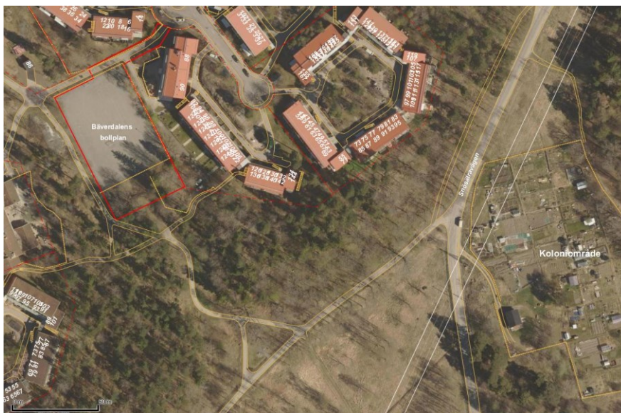
Bilden visar Bäverdalens BP till vänster och Snösättra kolonimråde till höger.

I stadens budget för 2018 går att läsa att alla barn oavsett bakgrund och förutsättningar ska kunna ha möjlighet att idrotta och alla ska kunna känna sig trygga i stadens idrottsanläggningar. Alla som besöker idrottsevenemang eller motionerar och idrottar i Stockholm ska göra det utan risk att bli utsatta för våld och utan att behöva uppleva otrygga miljöer.