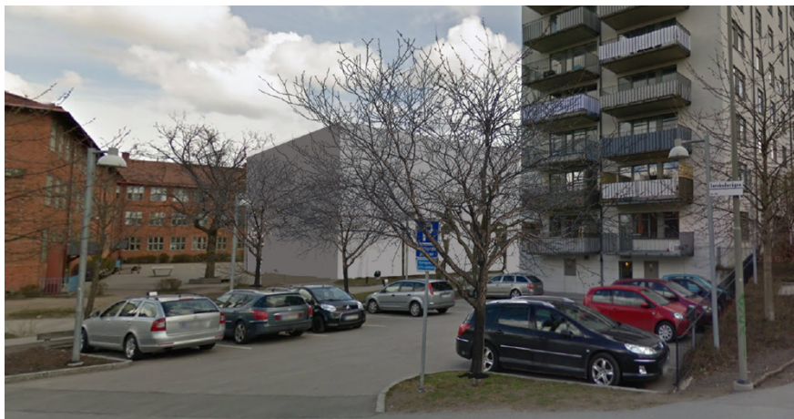
Volymillustration från Larsbodavägen