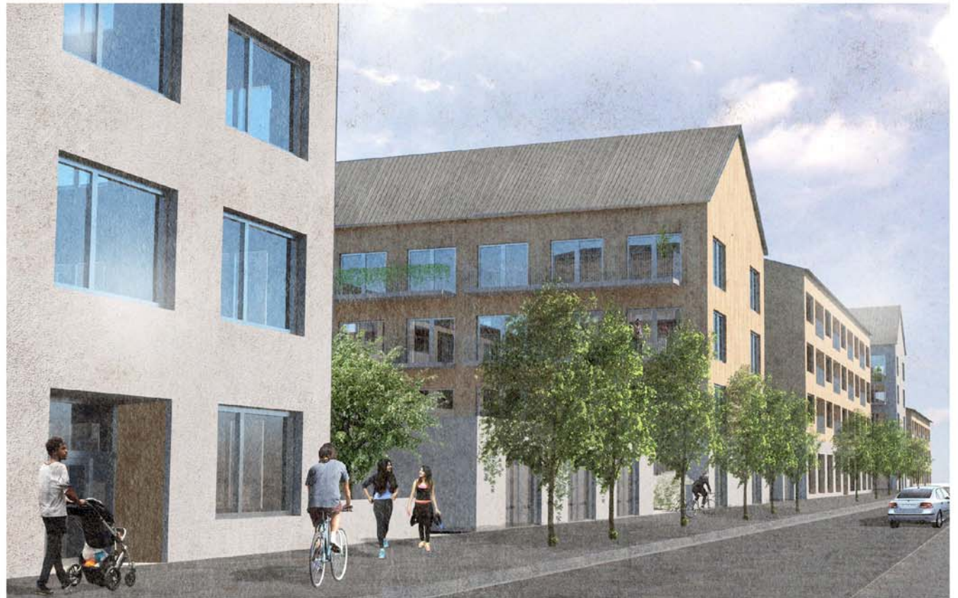
Den nya bebyggelsen sedd från sydväst på Bäverbäcksvägen