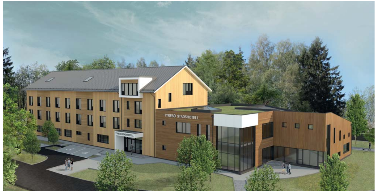
Hotellet sett från nordväst

Byggnadskroppen består utav tre varierande sammansatta volymer: hotell, konferens och kök. Huvudbyggnaden, hotelldelen, dominerar i en ljus färgskala med vertikalt och horisontellt beklädda träpaneler. Konferensdelen är lägre, i mörkgrå nyans med inbjudande glasparter i nordväst- och sydriktning. Dess söderläge har dubbel takhöjd, vilket ger bättre ljus och luftförhållanden och förstärker husets karaktär. Köksdelen är en våning hög med sedumtak.