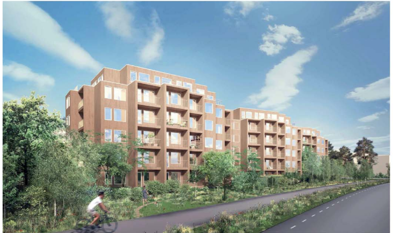
Den nya bebyggelsen sedd från sydväst på Tyresövägen

Bebyggelsen har en tydlig, unik karaktär med en oregelbunden, veckad form och djupa balkongnischer. Som kontrast till den livfulla formen har en enkelhet i material eftersträvat. Fasaderna kläs med träpanel som behandlas för att åldras vackert. Med sina fem våningar och en indragen sjätte våning ansluter de till det nya grannskapets skala. Balkonger i tre väderstreck och generösa utblickar från lägenheterna bidrar till att levandegöra gårdar och omgivande gaturum.