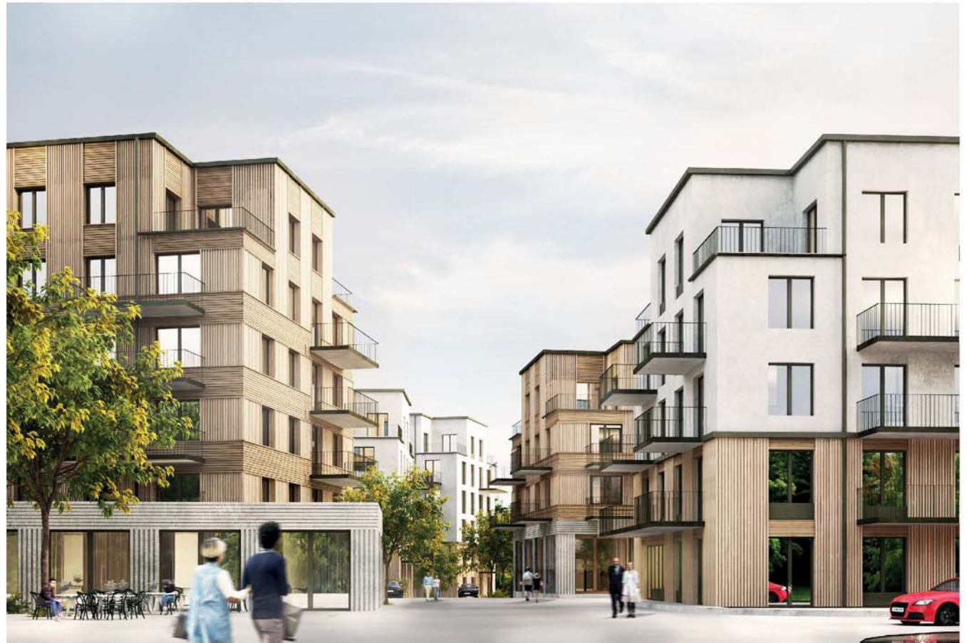
Gatuvy, ny gatuslinga sedd från väster

Delområdet består av åtta hus som har både likheter och skillnader för att skapa en mjuk variation i området. Alla byggnader har indrag i takvåningens volym, vilket bryter ned byggnadsskalan och ger byggnaderna en karaktärsfull profil. Fönsterlägen är ordnade för att skapa en harmonisk bakgrund mot vilken olika balkonglägen skapar variation. Husens bottenvåningar öppnar upp sig mot gatan och entréerna annonserar sig genom att vara generösa och uppglasade. Gemensamma funktioner ryms i bottenvåning i anslutning till gatan. Fasaderna består av tre material - trä, ljus puts och ljusgrå betong.