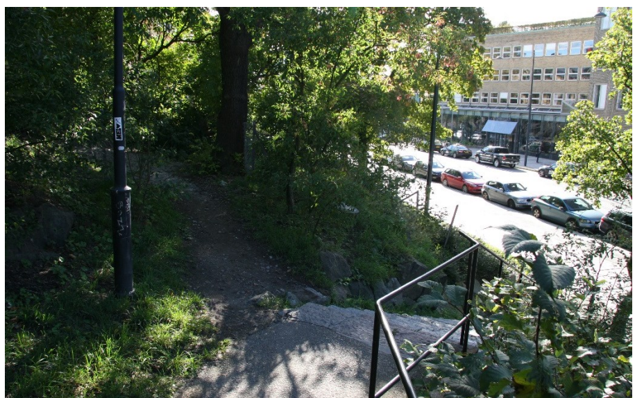
Smitväg i slänten ovanför Torsgatan.