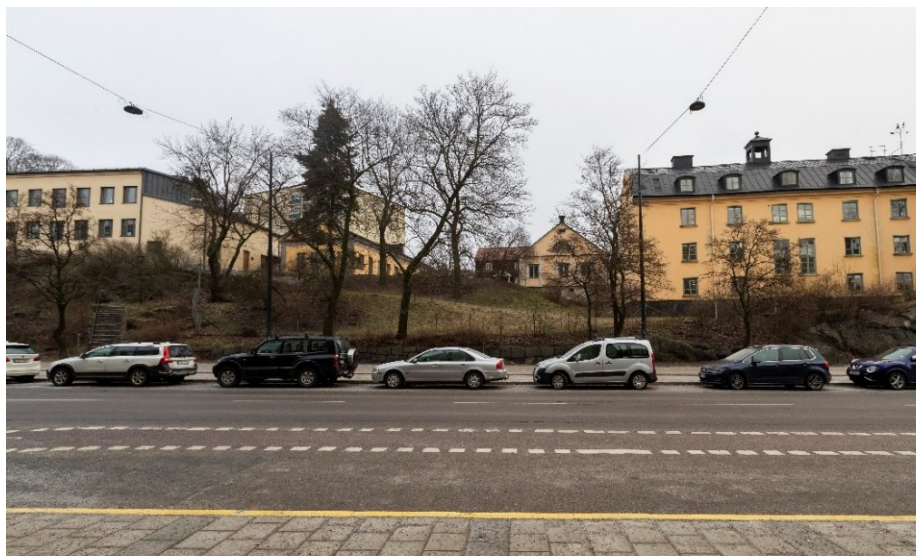
Platsen sedd från Torsgatan. Den befintliga trappan upp i parken till vänster.

Den aktuella platsen för en ny terrass och entré utgörs idag av en gräsklädd sluttning, belägen mellan två bergsformationer utmed Torsgatan. Platsen innehåller några mindre lönnar samt buskage. Mot gatan löper en låg mur av natursten och ett stängsel. Intill finns en befintlig terrängtrappa som leder till Vasaparkens högre belägna delar och till Sabbatsbergssområdet. Det finns smitvägar i terrängen som vittnar om ett behov av komplettering av trappor och gångvägar. Det finns belysning i trappan men den behöver förstärkas.