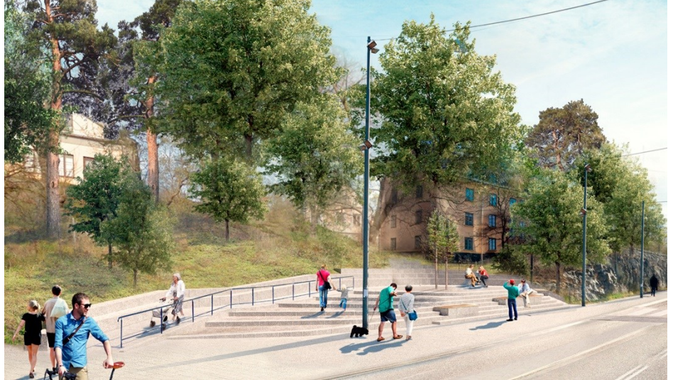
Den nya entréplatsen. Illustration Bonnier Fastigheter/Tengbom.