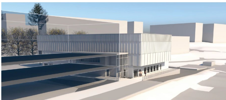
Perspektivbild på idrottshall och skola från norr

Den nya hallen ska bland annat innehålla en fullstor idrottshall, en mindre verksamhetsyta för exempelvis dans samt omklädningsrum, personal- och städutrymmen. Parkeringsplatser för bil och cykel planeras invid idrottshallens entré. En planerad kvartersgata norr om fastigheten ska ansluta Hanstavägen till Finlandsgatan och rymma gång- och cykelvägar.