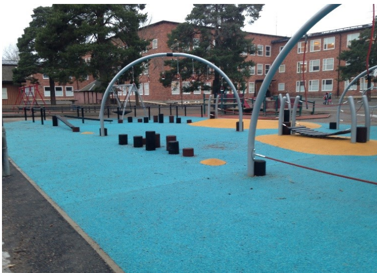
Figur 6 - Platsgjutet gummi på skolgård