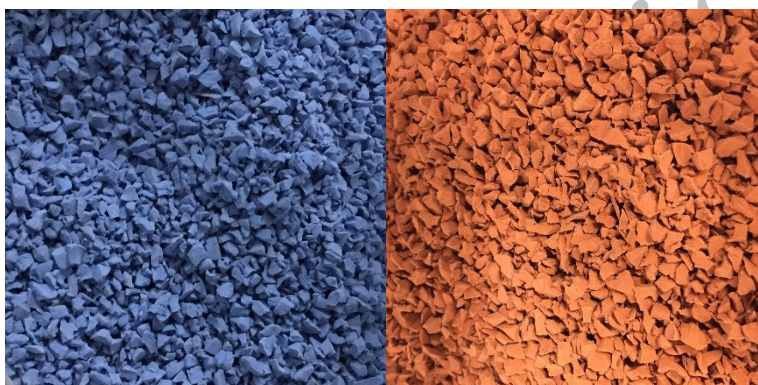
Figur 5 - Topplager platsgjuts av EPDM

Platsgjutet gummi består som regel av EPDM i varierande färger och används på aktivitetsytor men också i formationer på skolgårdar, förskolor och lekplatser. Bindemedlet av isocyanater bildar polyuretan efter härdning. Ska gummibeläggningen fungera som fallskydd läggs ett topplager av EPDM, som kan varieras i ett stort antal färger. Ett stötdämpande baslager , som regel av svart SBR (återvunna däck), läggs. Det finns även fallskyddsplattor som är gjutna i fabrik och alternativ till SBR som baslager i fallskyddssystem 9 . Ett alternativ av polyeten finns på marknaden 10 , övriga alternativ är ännu inte tillgängliga men flertalet av stadens leverantörer har uppgett att de arbetar med produktutveckling.