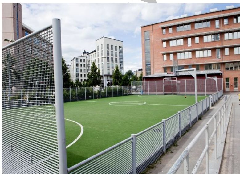
Figur 4 - Multisportarena skolgård