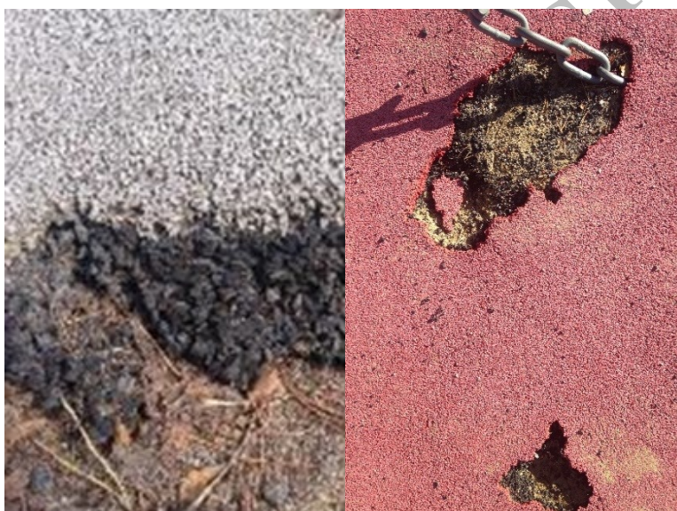
Figur 7 - Platsgjutet gummi med fallskydd på lekplats. Grått och rött topplager av EPDM, svart baslager av SBR, återvunna bildäck