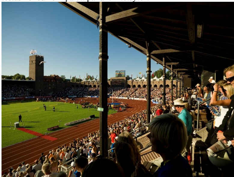
Figur 3 – Stadion Arena

i flertalet kulörer 5 . Konstgräset har ofta fyllnadsmaterial av sand eller gummigranulat 6 . I Stockholms stad ska sand användas som ifyllnadsmaterial i konstgräs på skolgårdar i stadens regi 7 . På Södermalm testas kokos/kork på ett par aktivitetsytor.