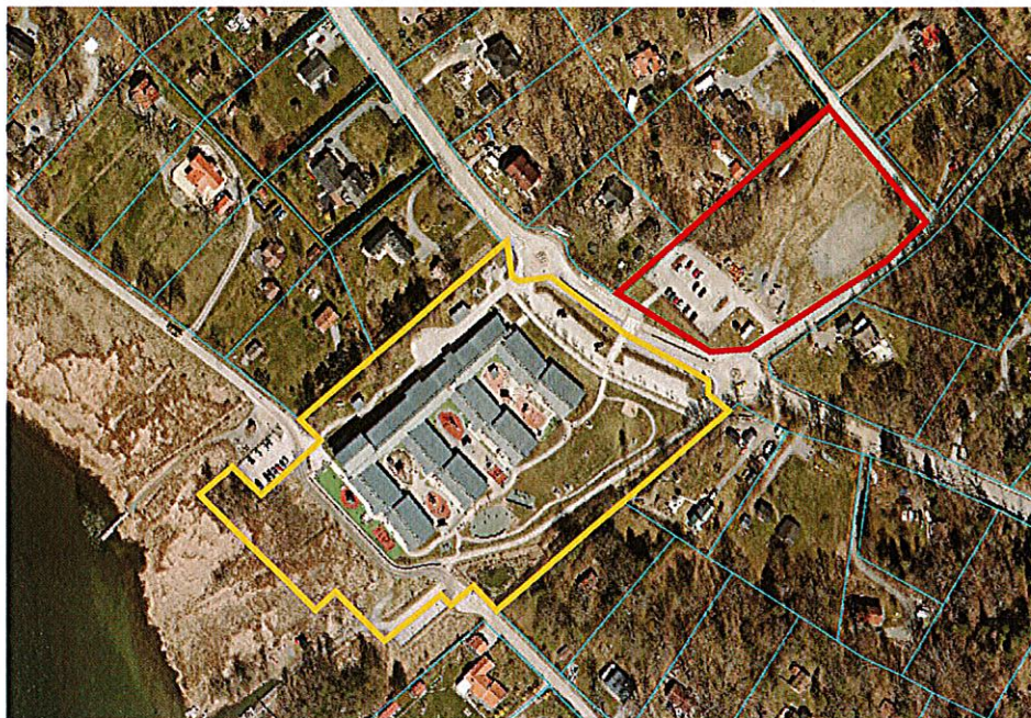
Del av fastighet Trinntorp 1:1 med föreslagen markanvändning för förskola och etableringsyta (rödmarkerad) och fastighet Trinntorp 1:196 (gulmarkerad)