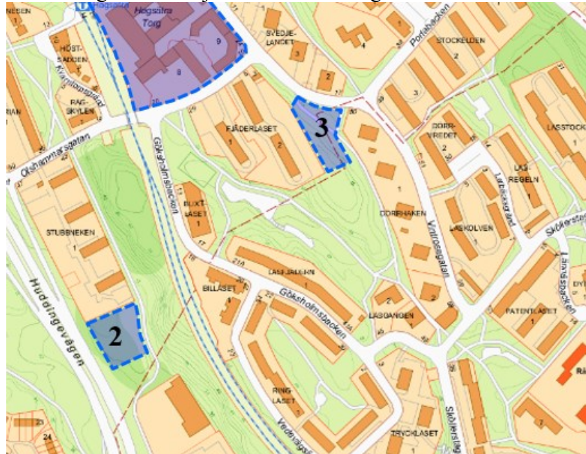
Figur 1: Markanvisat område markerad med en trea. Källa: markanvisningsärende till exploateringsnämnden 2018-08-23, dnr: E2017-03951.

Exploateringsnämnden anvisade 2018-08-23 mark för förskola inom fastigheten Älvsjö 1:1 till Skolfastigheter i Stockholm AB.