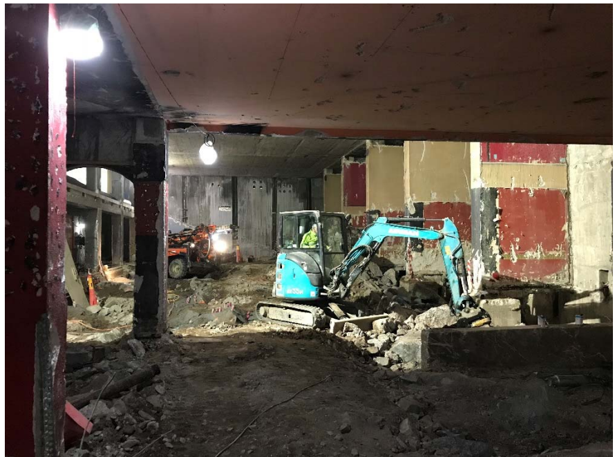
Bergspräckning i före detta Göta Källare.

Projektet befinner sig i nuläget i byggfasen. På grund av att en större mängd berg än förväntat har påträffats under huset tar bergspräckningen och grundläggningen längre tid än beräknat. Huset beräknas dock kunna återöppnas sommaren 2020, vilket innebär att projektets tidplan ligger i linje med det reviderade genomförandebeslutet.