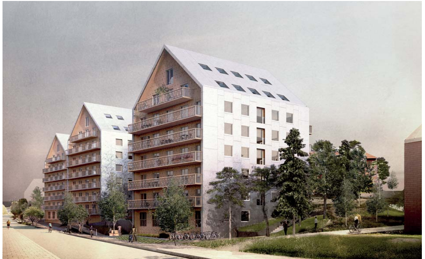
Visionsbild från Granitvägen