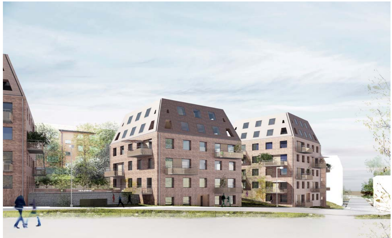
Visionsbild från Granitvägen