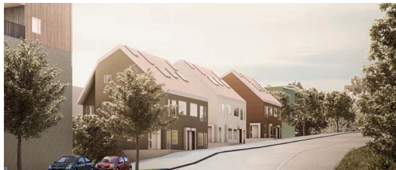
Vy över stadsvillorna vid Granitvägen samt gården i kvarteret