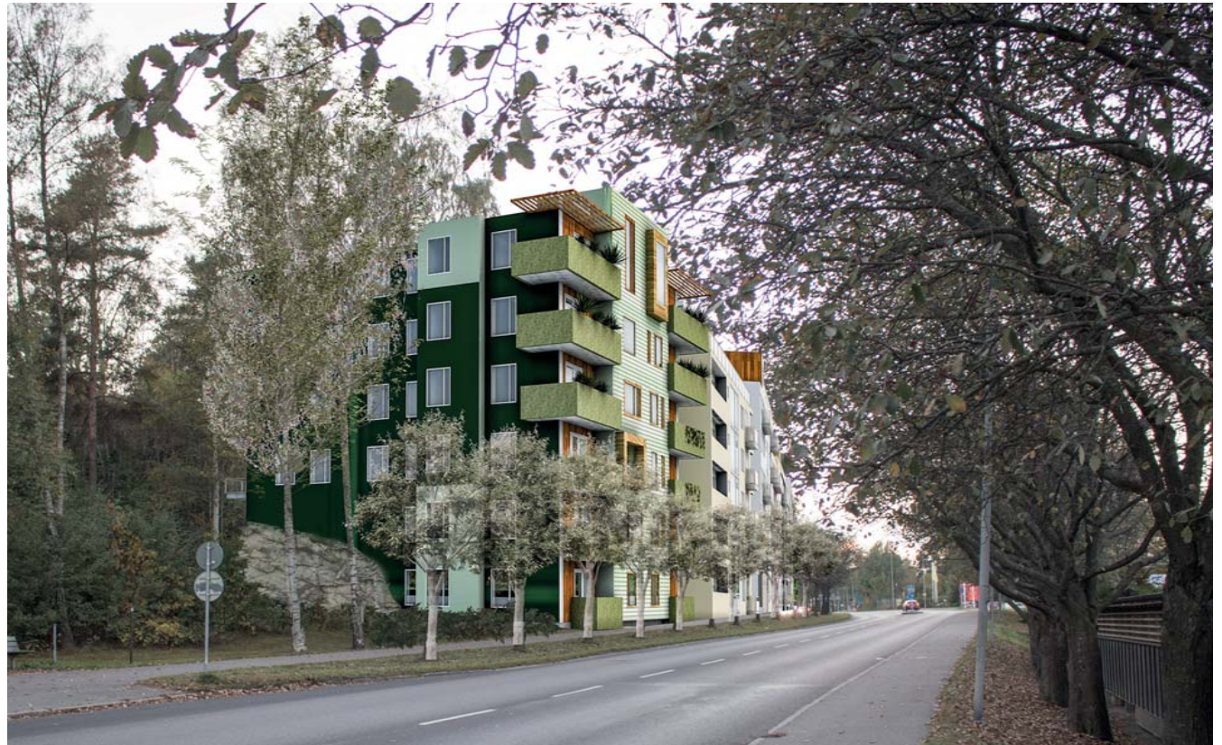
Visionsbild från Bollmoravägen västerut

För att rama in gathusens bostadsgård mot Granitvägens backe och bilda stödmur mot denna planeras tre stycken smala fyrfamiljshus. Husen som utförs med trästomme och träpanel, består av två lägenheter som båda har egen entré mot gatan och som har sin utbredning i markplanet på Granitvägens nivå och i underliggande suterrängvåning. Bottenvåningen mot gården utformas så att stora tomma fasadytor undviks. Fönster, entréer och grönska används för att levandegöra bottenvåningen. Byggnaderna följer Granitvägens sluttning. Där höjdskillnader uppstår tas de om hand på ett omsorgsfullt sätt med terrasser och murar.