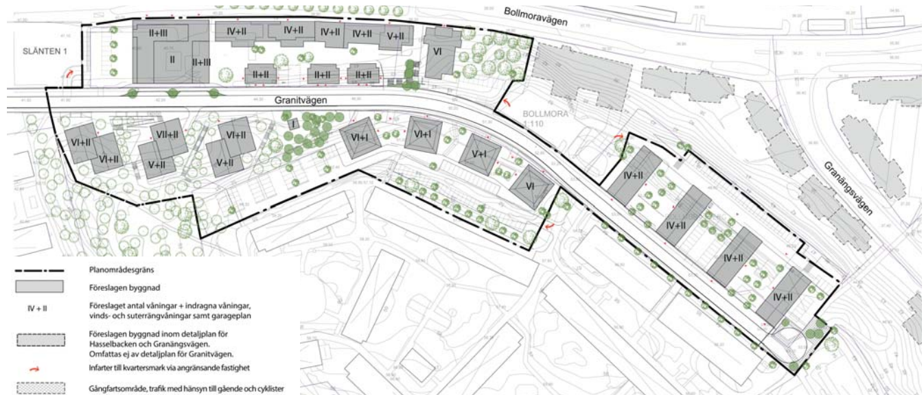
Illustrationsplan och 3D-vy

De stora höjdskillnaderna i området gör att flera av husen kommer att utföras med suterrängvåningar och klättra upp för sluttningarna. I dessa lägen ska omsorgsfull gestaltning av fasader, markplanering och utsparat natur knyta an till en mer mänsklig skala. Större höjdskillnader delas upp i flera nivåer.