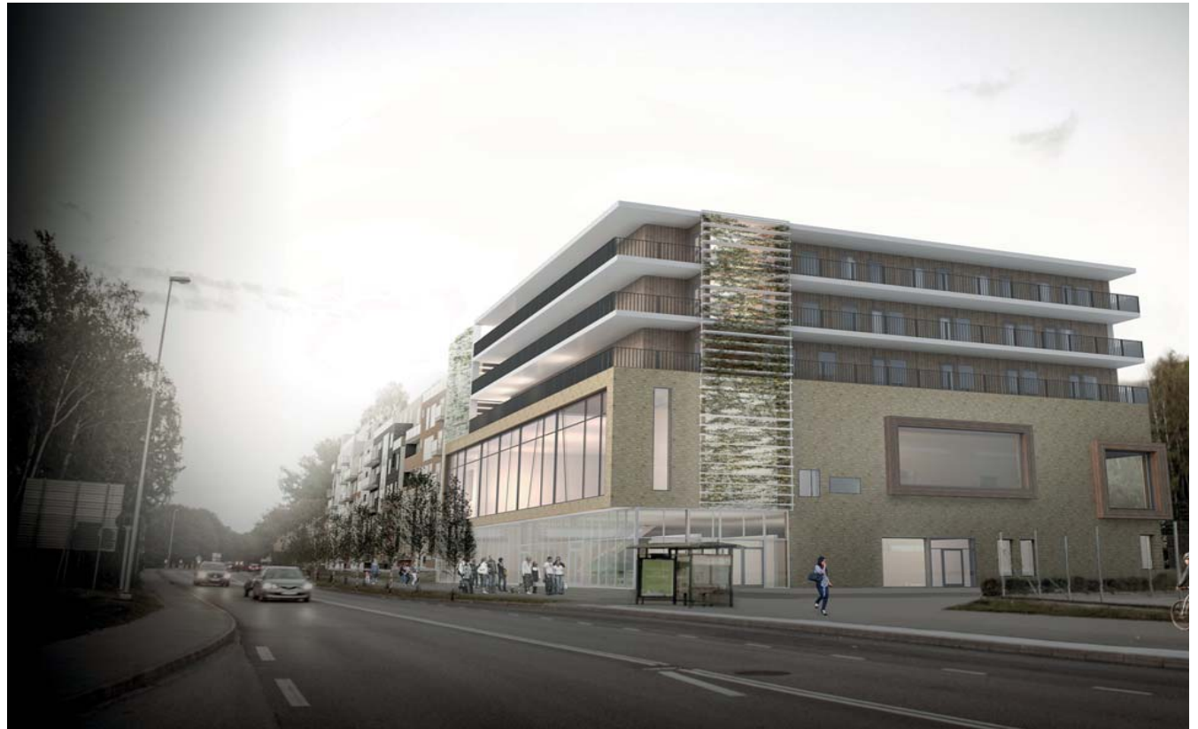
Visionsbild från Bollmoravägen österut

Fasader mot Bollmoravägen är individualiserade med variation av höjd och fasadmateriell (puts, tegel och träpanel). Genom takterrasser och indrag av fasadliv sänks takfotshöjden mot gatan så att bebyggelsen upplevs som lägre. Balkonger mot gården utförs i huvudsak med glasade, genomsiktliga balkongräcken. Räckerna, position och avskiljare kan varieras för att för att fasaden inte ska upplevas för långsträckt. Balkonger mot gatan utförs med genomsiktliga räckerna av glas eller stående stålspröjs.