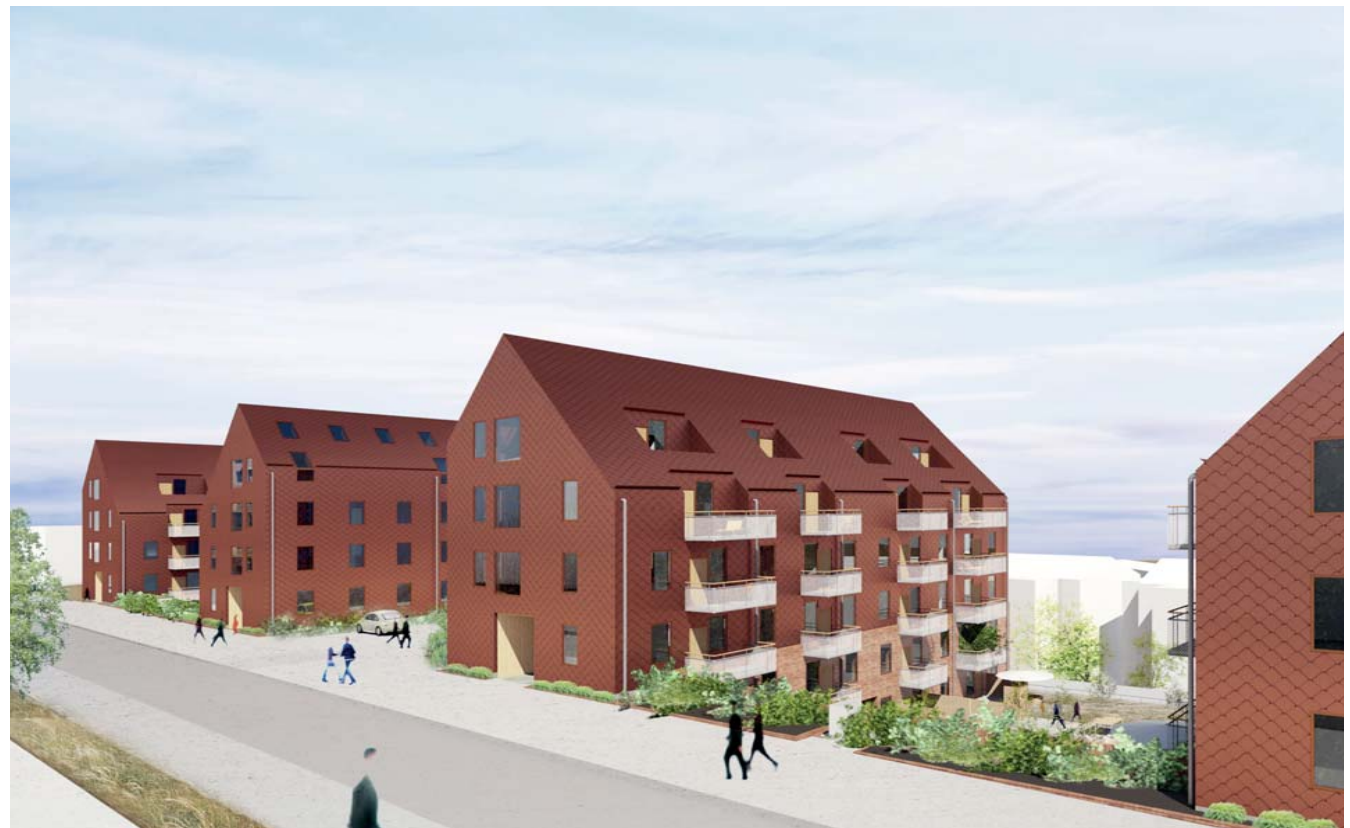
Visionsbild från Granitvägen