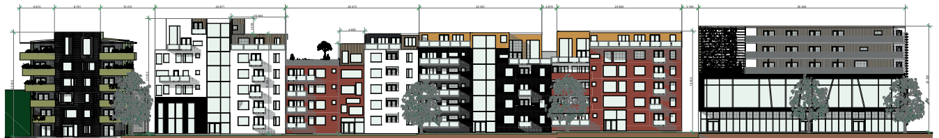
Elevation från Bollmoravägen